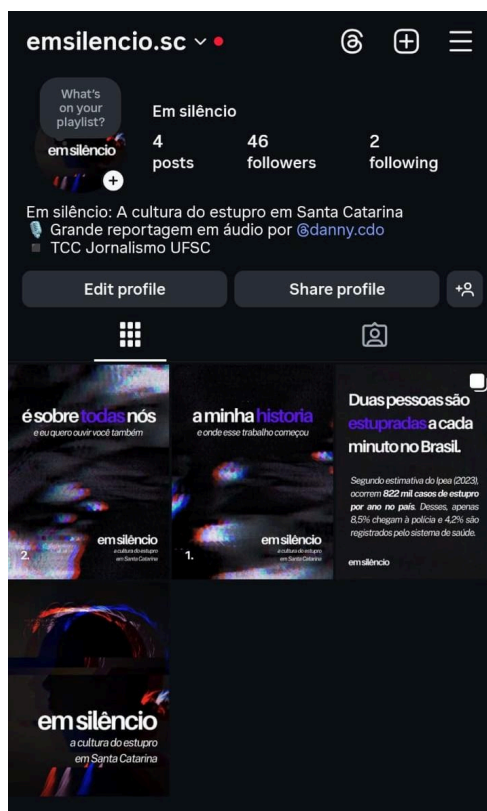
Figura 1 — Print do Instagram de “Em silêncio”