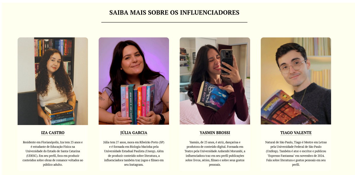
Figura 9 – Biografias dos influenciadores

Também achei interessante a ideia de colocar pequenas biografias sobre cada um dos influenciadores citados na reportagem. Creio que a escolha seja algo que chame a atenção em meio a uma grande quantidade de texto.