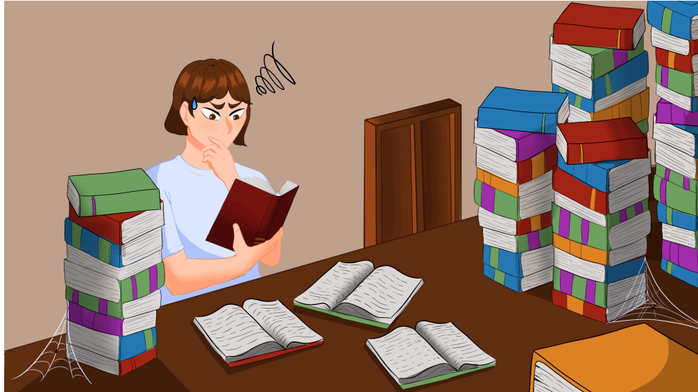
Figura 6 – Ilustração da retranca “Leitura como atividade coletiva”