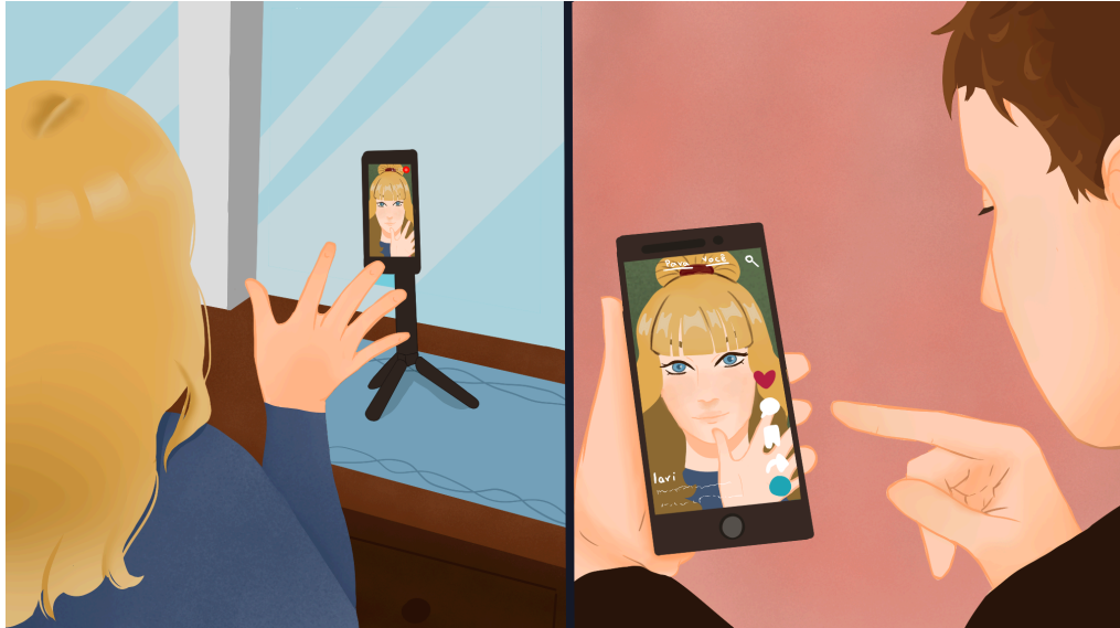
Figura 4 – Ilustração de capa

Além disso, usei ilustrações feitas por uma amiga para compor a estética de cada uma das retrancas e da capa da reportagem. Cada desenho representa uma temática da reportagem.