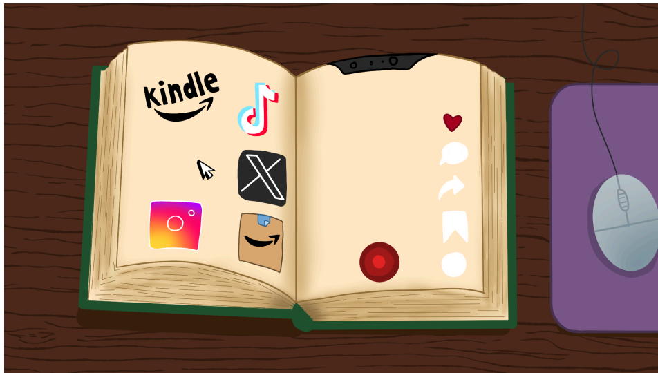
Figura 8 – Ilustração da retranca “O mercado da leitura”