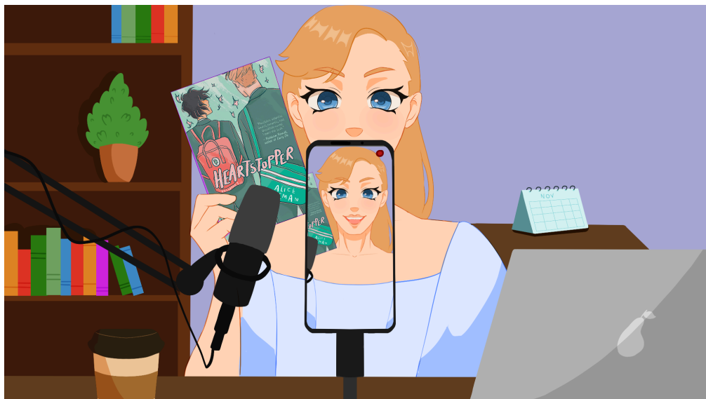
Figura 5 – Ilustração da retranca “Como trabalham os influenciadores”