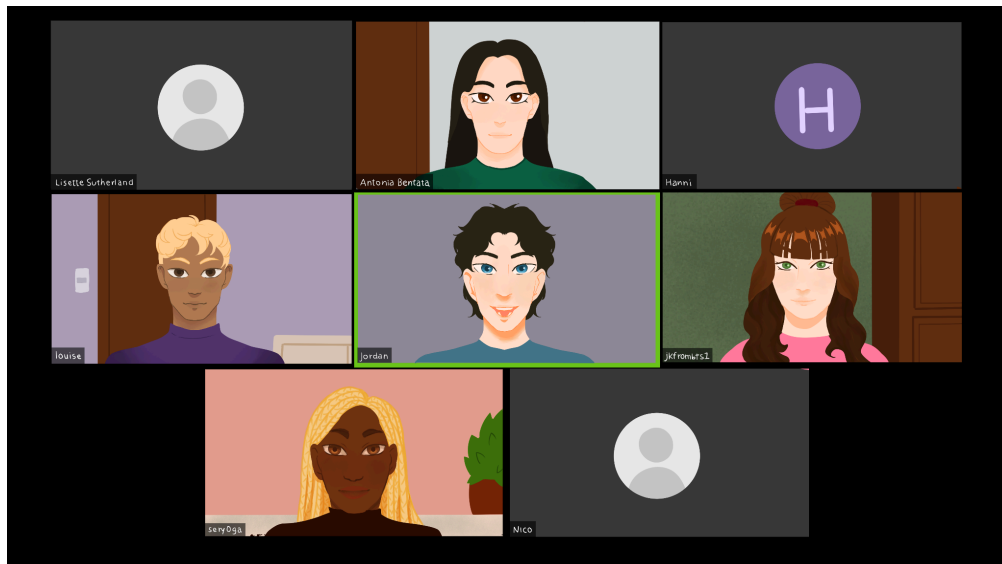
Figura 7 – Ilustração da retranca “Do prazer à obrigação”