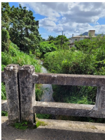
Figura 6 - Imagem registrada no dia da entrevista da Bruna.

Abril 2015.