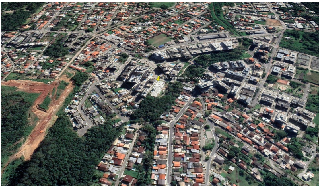
Figura 5 - Imagem registrada por satélite do bairro Córrego Grande em 2022.