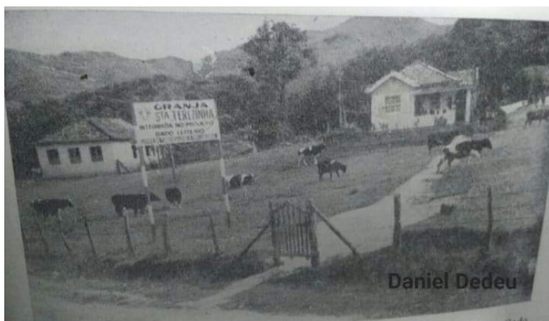
Figura 2 - Registro Fotográfico da Casa Escola do Córrego.