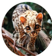
GATO MARACAJÁ ameaçado de extinção