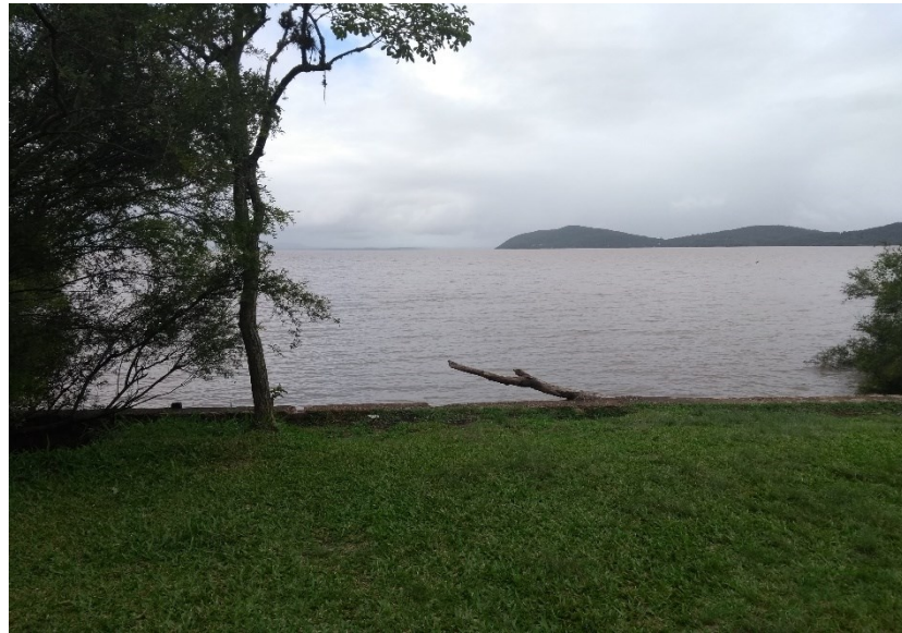
Figura 6 – Praia do Veludo, com vista para a Ponta Grossa