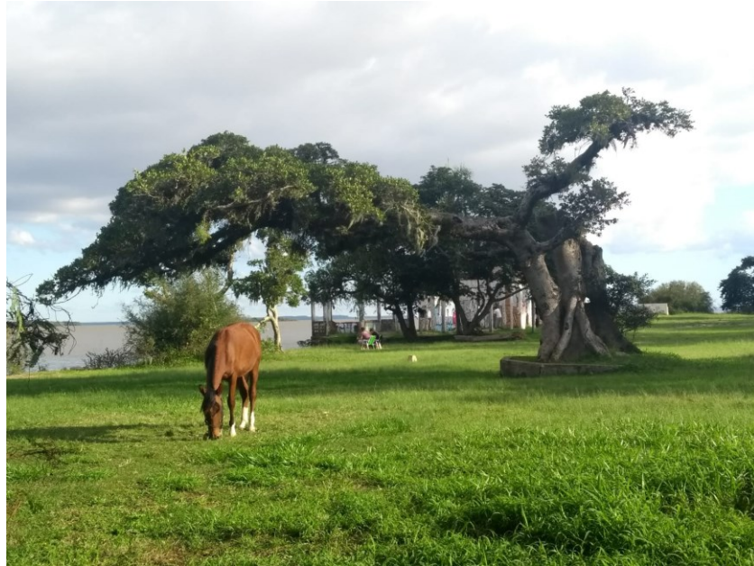
Figura 4 – Praia do Leblon no Belém Novo