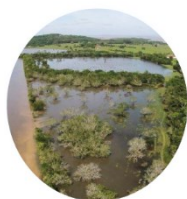
FAZENDA DO ARADO VELHO em período de cheias do Guaíba