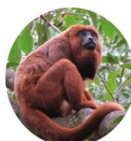
BUGIO RUIVO espécie em extinção