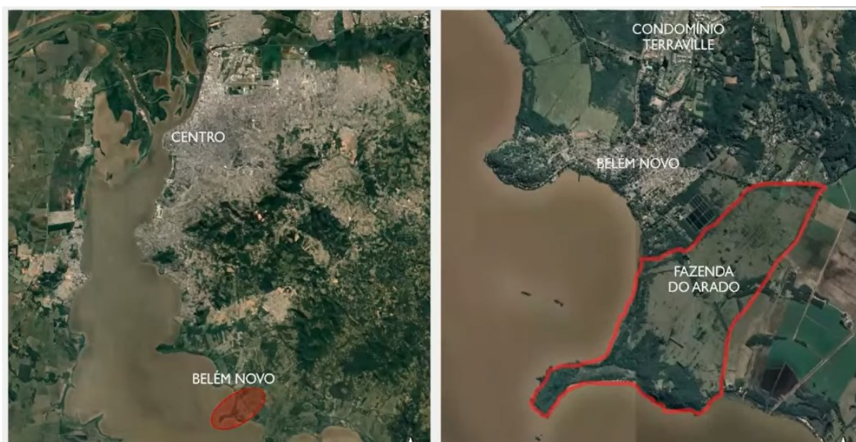
Figura 9 - Área da Fazenda do Arado, junto ao bairro Belém Novo