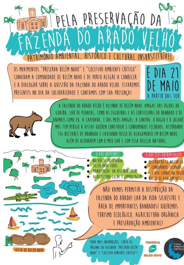
Figura 14 – Panfleto de divulgação do grupo