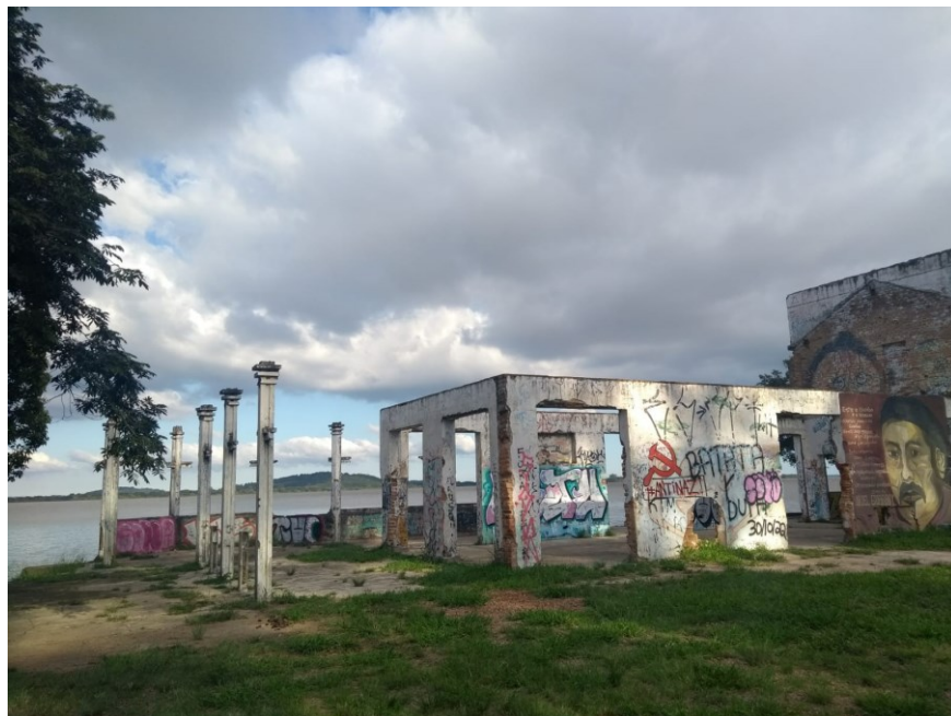
Figura 5 – Ruínas de restaurante na praia do Leblon