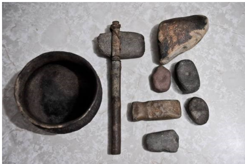
Figura 16 – Artefatos arqueológicos da região da Fazenda do Arado Velho