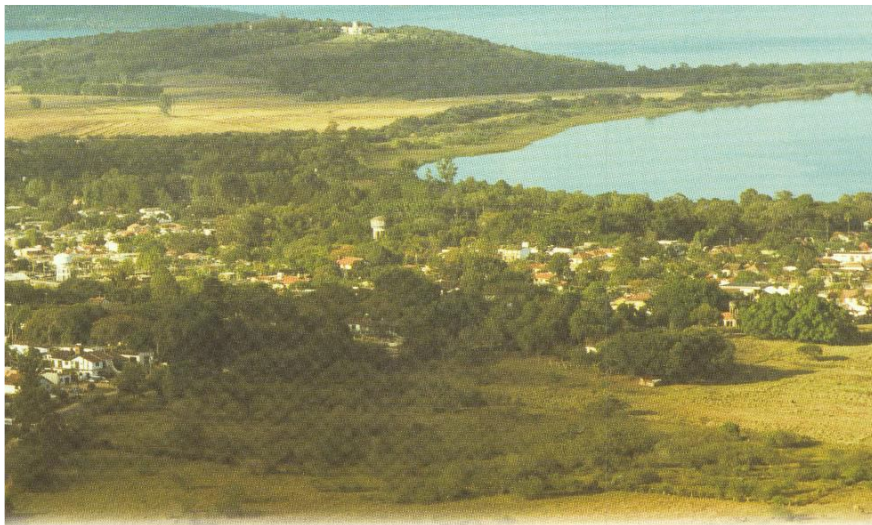
Figura 2 – Visão panorâmica da região do Belém Novo