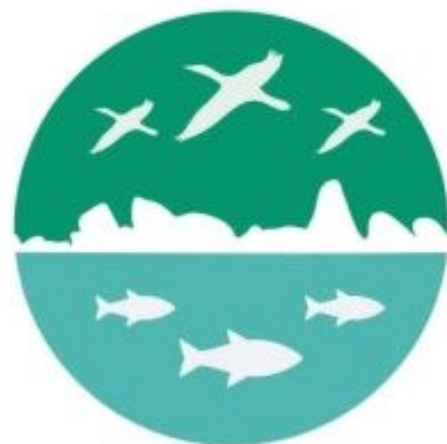
Figura 12 – Logomarca do grupo Preserva Belém Novo