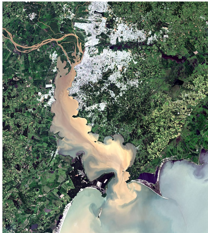
Figura 1 – Vista aérea do Lago Guaíba e a cidade de Porto Alegre

estradas dos tropeiros, com o intuito de intermediar o caminho por terra, estendendo-se a estrada que ia até o sul de Santa Catarina. A nova estrada dos tropeiros chegou na região próxima à Porto Alegre em 1736, assentando os chamados Campos de Viamão, com a atividade ligada à pecuária, em abastecimento da produção de carne do Império. O local progressivamente cresce em importância, na medida em que a região do forte de Rio Grande é sucessivamente atacada pelos espanhóis, motivando a criação de um porto para os campos de Viamão em 1752 com o envio de imigrantes portugueses da Ilha dos Açores; este porto se consolida e em 1772 é fundada como capital a cidade de Porto Alegre (Porto dos Casais), centralizando a administração do sul do Império. Organizando-se como um porto fluvial às margens do Lago Guaíba, a cidade buscava dar unidade local às terras do entorno, que foram distribuídas pelos portugueses no formato do sistema de sesmarias, assim como os agrupamentos sociais (vilas e freguesias) que se formariam junto à essas terras, espalhadas demograficamente pela região.