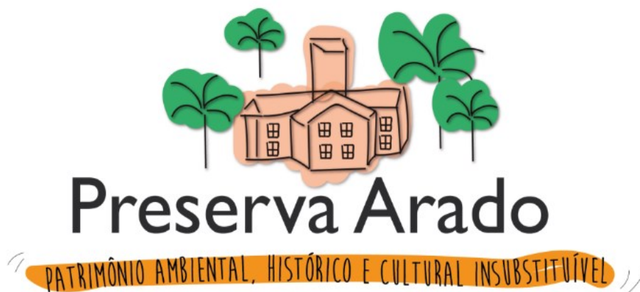
Figura 13 – Logomarca da campanha Preserva Arado