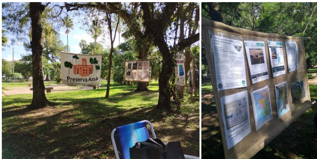
Figura 11 – Exposição fotográfica no bairro Belém Novo