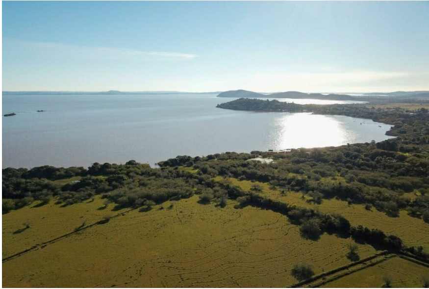
Figura 3 – Visão panorâmica da região do Belém Novo em ângulo reverso