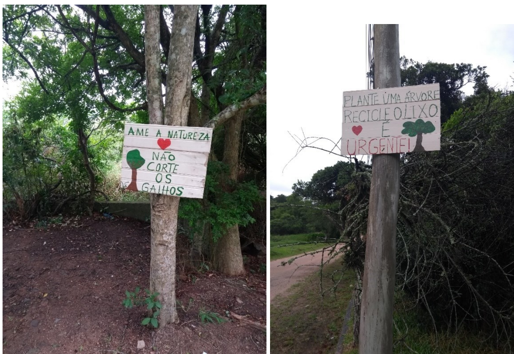
Figura 10 – Placas instaladas no bairro Belém Novo

À medida que avançava a denúncia ao empreendimento, o grupo – que não possui CNPJ – concentrou seu discurso em uma denúncia jurídica do empreendimento, fomentado através da mobilização de uma rede de contatos. Junto com o grupo de estudantes que lhe apoiava, produziu um laudo em que denunciava o EIA-RIMA 45 do projeto imobiliário, o que provocou a investigação do Ministério Público. Em contrapartida, integrantes do grupo foram acusados judicialmente de “levarem indígenas” para a área 46 , o que colocou mais dificuldades jurídicas ao empreendimento. No estágio atual da “judicialização” da disputa em torno do Arado, um novo EIA-RIMA deveria ser apresentado pelo empreendedor do projeto até o final de 2023.