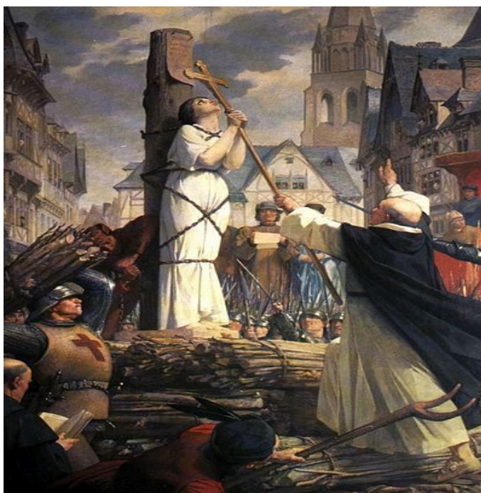
Figura 1 - Inquisição medieval contra mulheres condenadas de bruxaria.

mulheres ligadas a religiões de matrizes africanas, como Umbanda e Candomblé são frequentemente alvo de preconceitos que as ligam à bruxaria (Cunha, 2017).