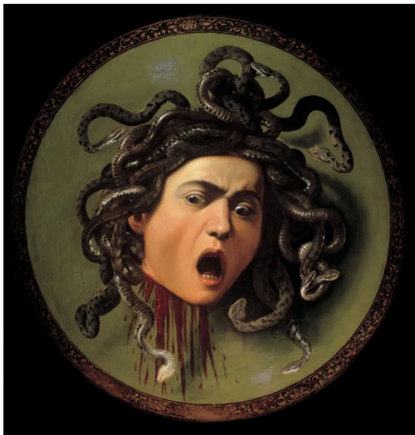
Figura 4 - Ilustração de Caravaggio, Medusa (1595-1596)

Essa narrativa exemplifica discursos milenares que demonizam mulheres como sedutoras destrutivas, ecoando em perseguições a curandeiras — vistas como "medusas" por saberes sobre corpo e ervas —, conectando mitos gregos aos estigmas inquisitoriais (Gorgoneion como apotropaico em Freud, 1922).