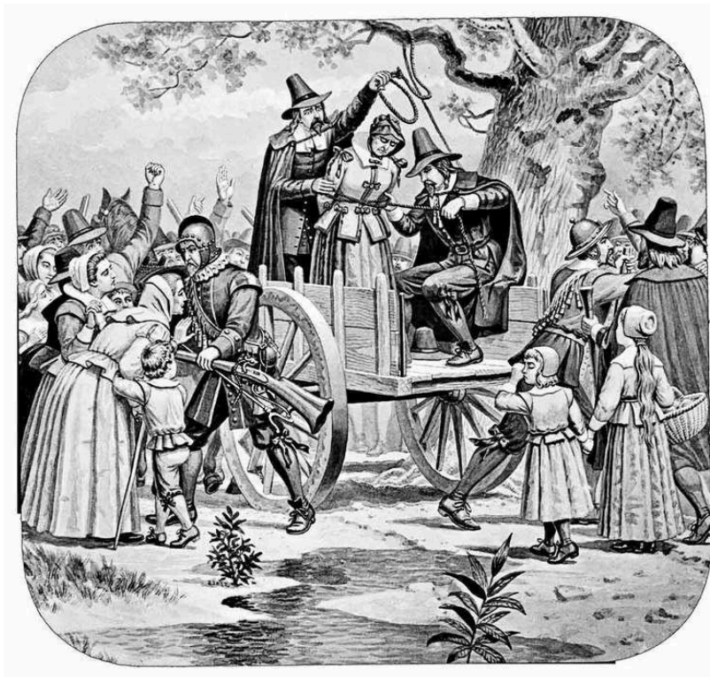
Figura 5 - Ilustração Bridget Bishop foi a primeira acusada de bruxaria e executada em Salém

atos de curandeirismo e benzimento como bruxaria – crime este passível de morte por meios hediondos. Com a criação do Tribunal do Santo Ofício, as acusadas recebiam julgamento pelos crimes de benzeção por irem de encontro aos dogmas da Igreja, e portanto, também contra Deus. (Oliveira, 1985, p.21).