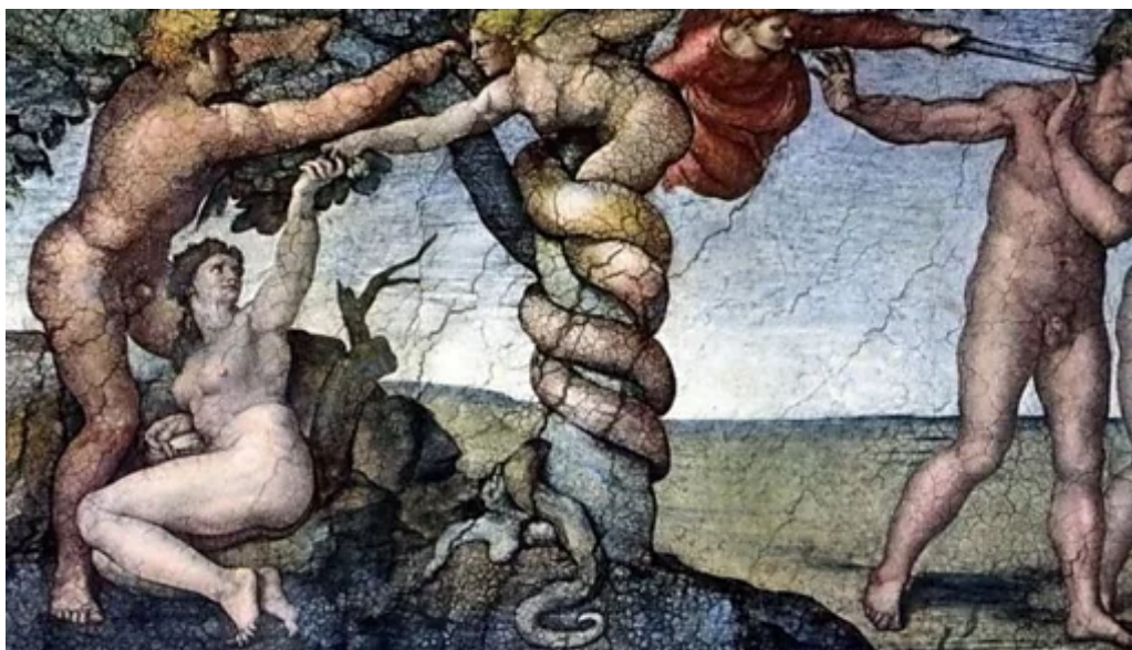
Figura 3 - Ilustração de "Lilith", quadro de John Collier (1887)

dominará” (Gênesis, 3:16). Assim, tanto na mitologia grega quanto no mito da criação que domina o imaginário ocidental, a mulher é a origem do mal que aflige a humanidade (Pinheiro, 2018, p. 153).