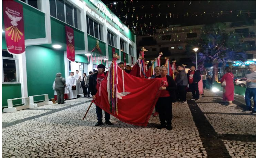
Figura 15 – Saída das bandeiras

nome do Império do Divino Espírito Santo”. Como observado por Michelute (2000, p. 20) “o Imperador, por sua vez, usa as instalações da prefeitura para os preparativos finais da corte”.