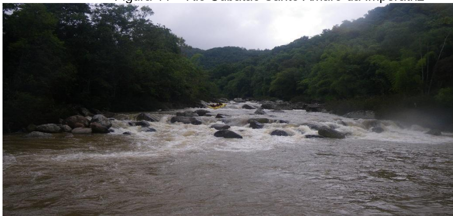
Figura 11 – Rio Cubatão Santo Amaro da Imperatriz

As nascentes do Rio Cubatão, estão dentro do Parque Estadual da Serra do Tabuleiro, uma importante área de conservação, mas parte do seu percurso pode ser utilizado na prática do Rafting, um atrativo a mais, pois atrai vários adeptos para este esporte, conforme observa-se na Figura 11.