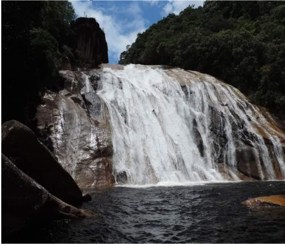
Figura 10 – Cachoeira do Rio Vermelho

particular e após segue por uma trilha. A cachoeira (Figura 10) está localizada no Parque Estadual da Serra do Tabuleiro.