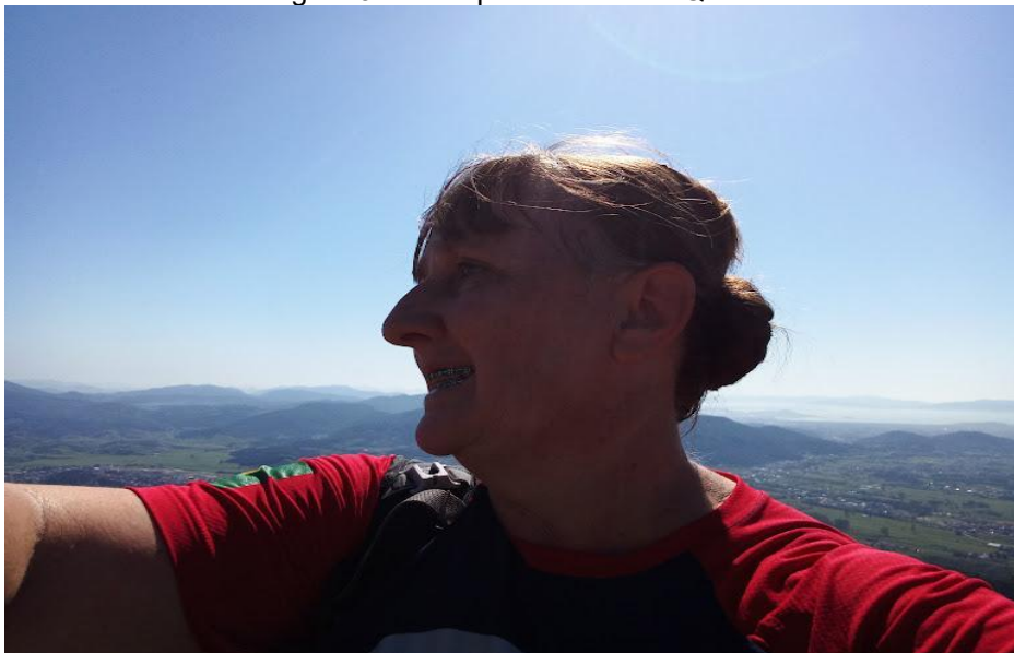
Figura 9 – No topo do Morro do Queimado

Além da prática do esporte ao ar livre, o Morro do Queimado, propicia momentos de lazer e contemplação, haja vista que do seu topo pode-se vislumbrar belas paisagens.