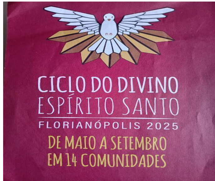
Figura 2 – Fôlder com o calendário do Ciclo do Divino de 2025 em Florianópolis 44