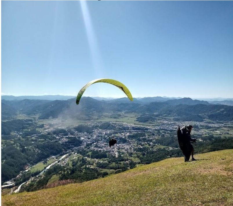
Figura 6 – Morro do Queimado

Tabuleiro, com 620 metros de altitude. A Figura 6, a Figura 7, a Figura 8 e a Figura 9 demonstram a prática do voo livre, decolando do topo do Morro do Queimado.