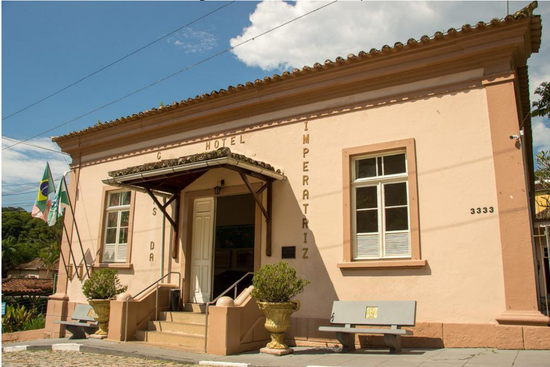
Figura 3 – Hotel Caldas da Imperatriz