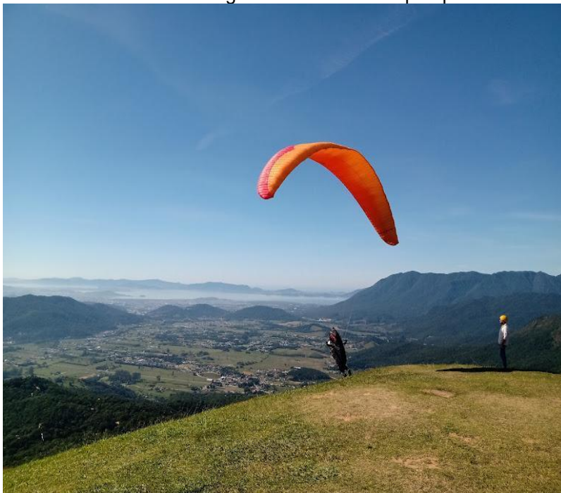
Figura 7 – Voo livre de parapente