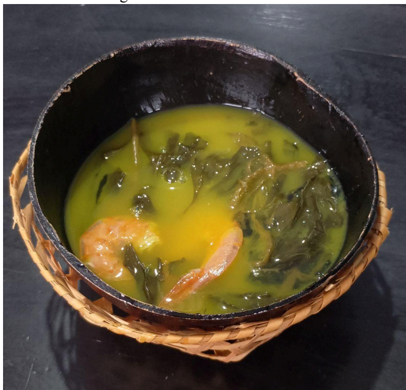
Figura 1 - Tacacá do Parazinho

“No tacacá podem ser reconhecidos elementos ameríndios: sua denominação (língua tupi), sua composição (derivados da mandioca brava), seu consumo (tucupi quente, associado à carne ou pescado) e o recipiente onde é servido (a cuia). Contudo é possível identificar igualmente elementos portugueses e/ou africanos: alho do mediterrâneo, camarões do mar, secos e salgados, trazidos do Estado do Maranhão e talvez o próprio jambú, muito embora seja de cultivo local. É possível que a receita original do tacacá tenha sido justamente valorizada pelo acréscimo desses ingredientes que são estranhos à cozinha indígena.” (ROBERT; VELTHEM; 2009, p. 6)