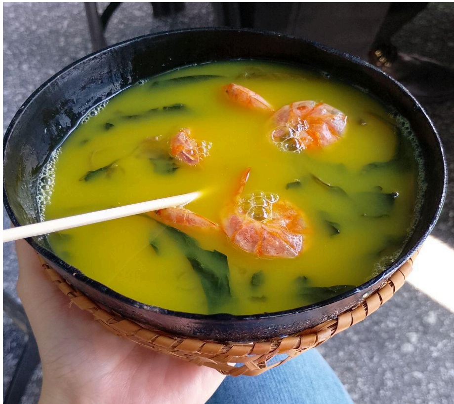
Figura 13 - Tacacá do Cristiano