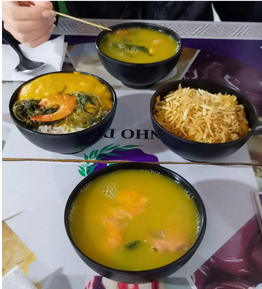
Figura 4 - Tacacá, vatapá e arroz com galinha do Cantinho do Pará

comidas típicas da região Norte, assim proporcionando aos nortistas a facilidade de consumir as comidas de seu local de origem e proporcionando também aos catarinenses o conhecimento da região Norte do Brasil.