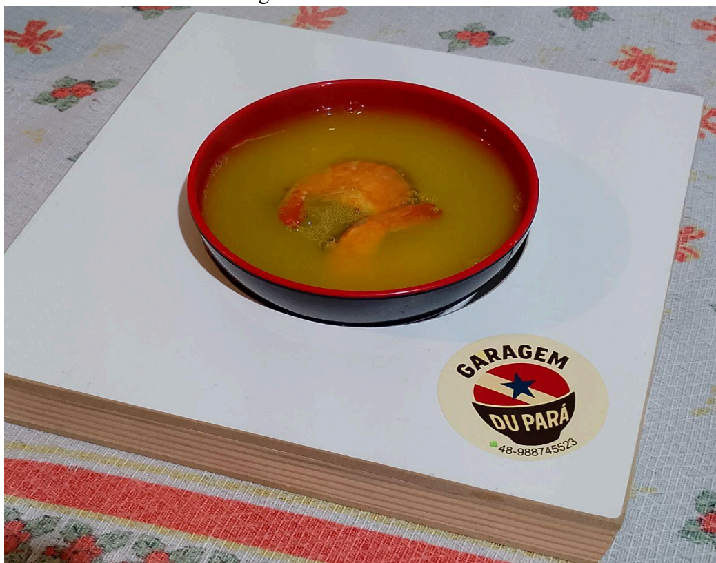
Figura 11 - Tacacá da Helen