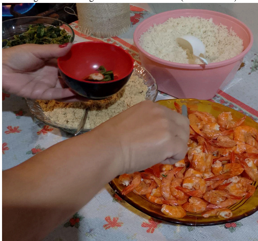
Figura 8 - Montagem do tacacá da Helen (camarão seco)