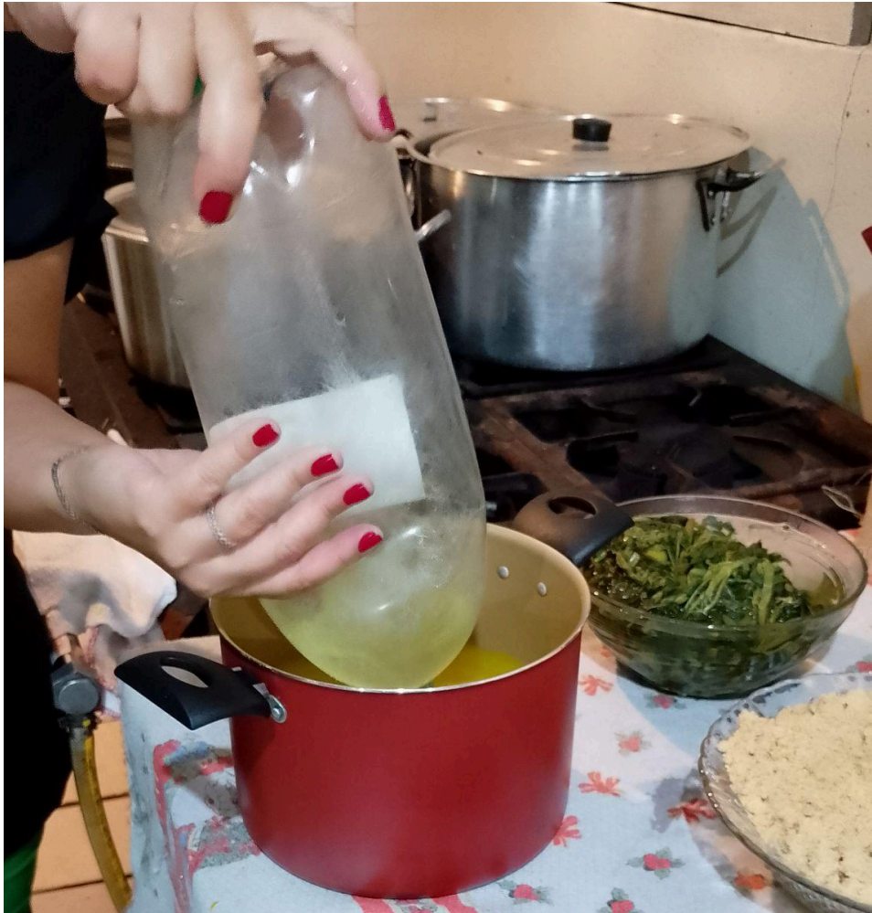
Figura 6 - Preparo do tucupi da Helen

"O jambu. Lá a gente encontra essa erva de forma mais fresca, né? Nas feiras, etc. Aqui já tem um pouquinho mais de dificuldade, a gente já vai encontrar de forma congelada. Então, assim, sensações que a gente tem do preparo, do paladar, né? O gosto e a sensação que o próprio jambu causa, ele fresco e ele congelado, dá um pouquinho de diferença pra quem realmente conhece e cresce provando esse tipo de prato. (VANESSA, 2025)