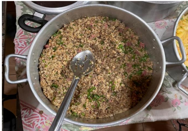
Figura 7. Paçoca de pinhão servida aos hóspedes da pousada de uma participante, em Urubici - SC.