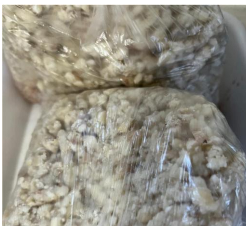
Figura 11. Pinhão cozido, triturado e congelado