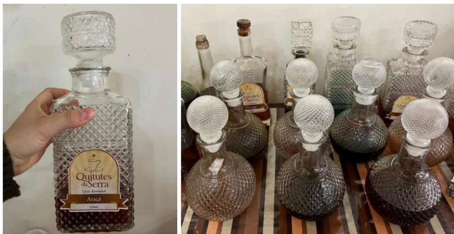
Figuras 8 e 9. Licores artesanais servidos no café colonial de uma participante, em Paineira - SC.