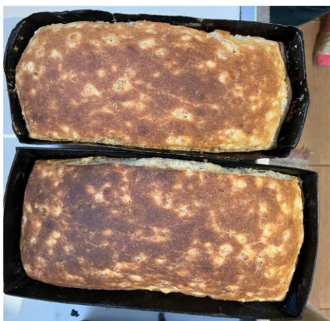
Figura 10. Pães de pinhão, servido aos hóspedes da pousada de uma participante, em Urubici - SC.