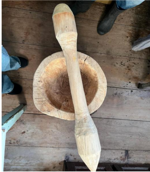
Figura 6. Pilão de madeira.