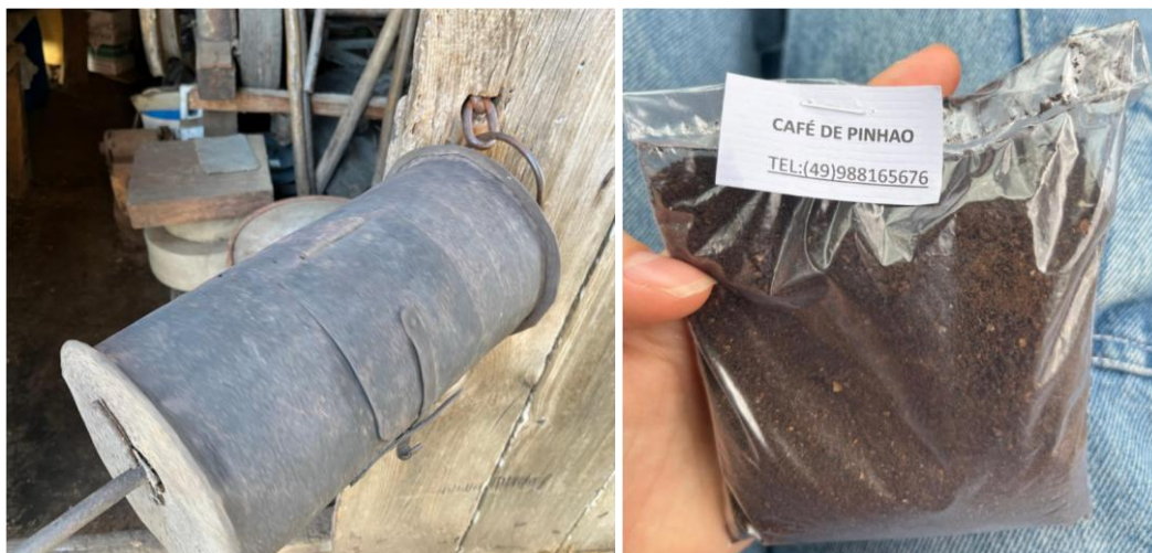
Figura 4. Torrador de café manual, conhecido como brustolim Figura 5. Café de pinhão, vendido no regionalmente comércio local de Pánel - SC.