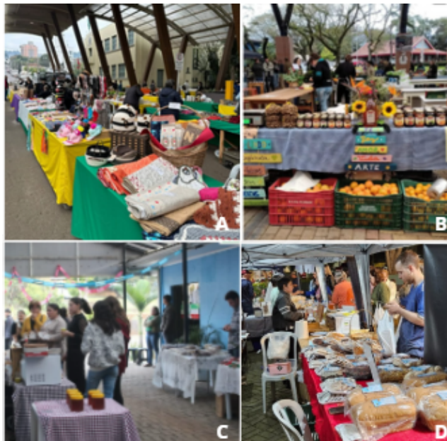
Figura 3. Produtos e comercialização das feiras dos municípios de atuação da CrediSeara. A-D. Feira da Rua Coberta de Concórdia (A); Feira Regional da Agricultura Familiar de Seara (B); Feira de Produtos Artesanais e Coloniais de Arvoredo (C); Feira Noturna da Agricultura Familiar e Artesanato de Seara (D).

sucos naturais e caldo de cana. As feiras contam também com espaços destinados ao artesanato, nos quais são ofertados enfeites, chaveiros e demais peças produzidas artesanalmente, representando a diversidade cultural e criativa das comunidades participantes (Figura 3).