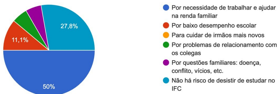
Gráfico 1 – motivos de desistência dos estudantes de estudar no IFC Blumenau. 2024.

A predominância da necessidade de contribuir para a renda familiar como motivo de desistência revela a intersecção entre desigualdade socioeconômica e acesso à educação superior, demonstrando que, para muitos estudantes, o sucesso acadêmico depende não apenas de esforço individual, mas da disponibilidade de apoio financeiro e estrutural adequado. Já o baixo desempenho escolar pode estar relacionado a lacunas na formação prévia, à dificuldade de conciliar trabalho e estudos, e à ausência de mecanismos institucionais de apoio pedagógico, como tutoria e acompanhamento acadêmico.