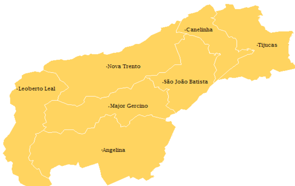
Figura 2: Mapa político-administrativo da MRG de Tijucas.