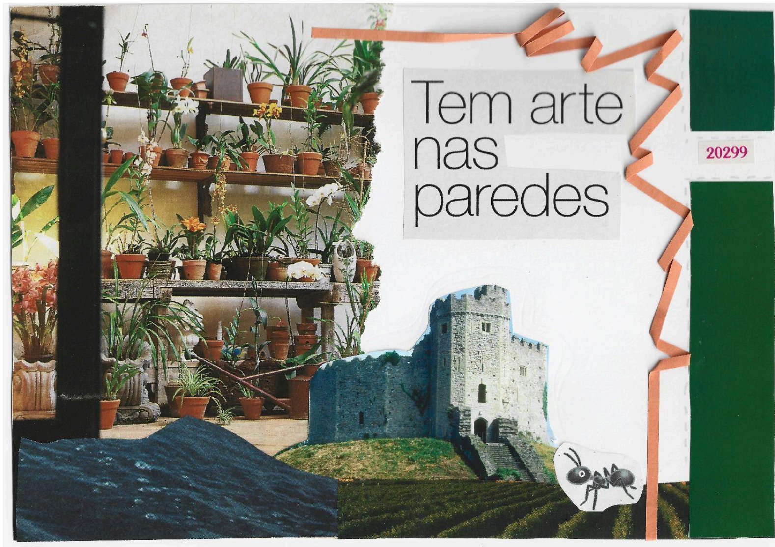
Colagem feita por mim, 2025.