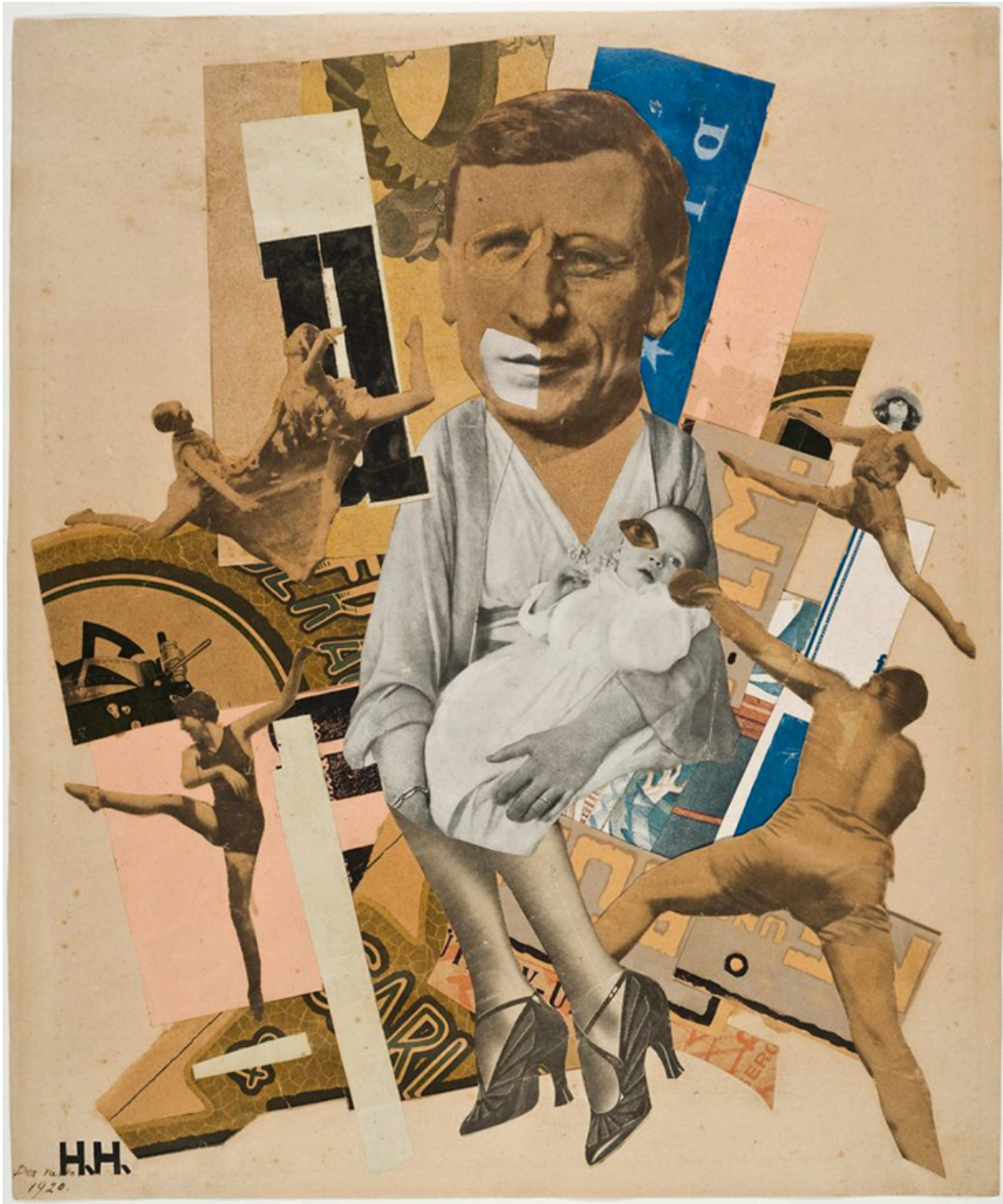
The Father (1920) por Hannah Höch