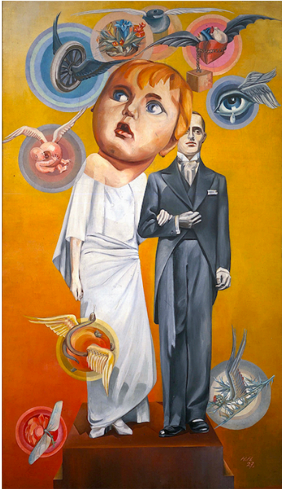
A Noiva/Pandora (1927) por Hannah Höch