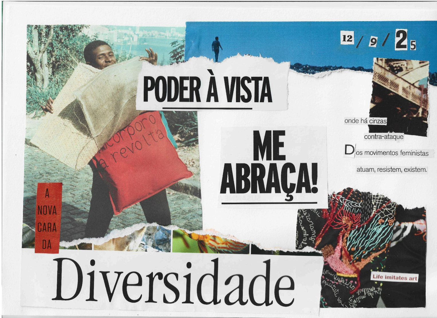
Colagem: Ocupação Aurora Furtado - Sala Lilás (UFSC)