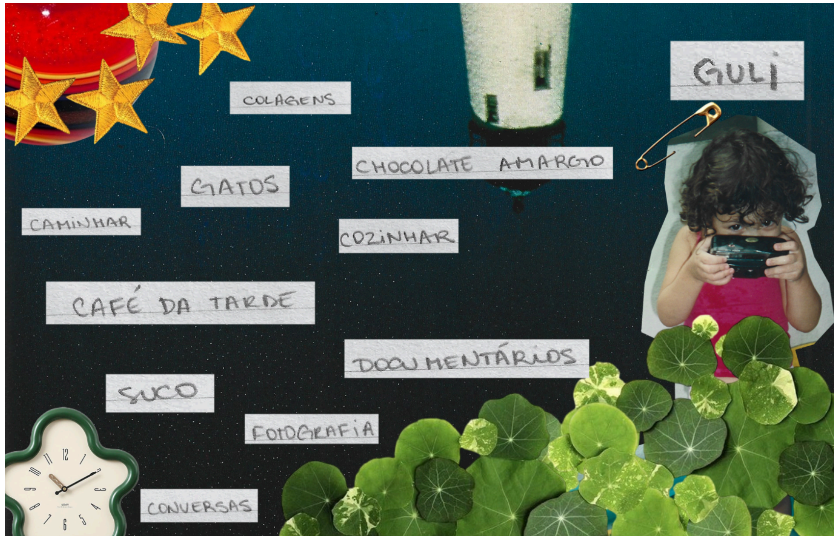
Colagem feita por mim (2024)