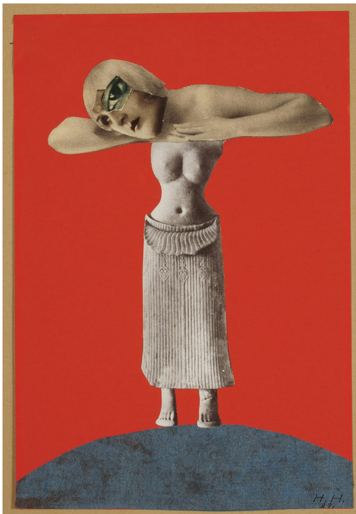
Sem título (1930) por Hannah Höch