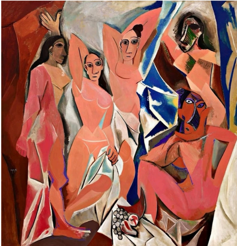
Les Femmes d'Alger (1907) por Pablo Picasso