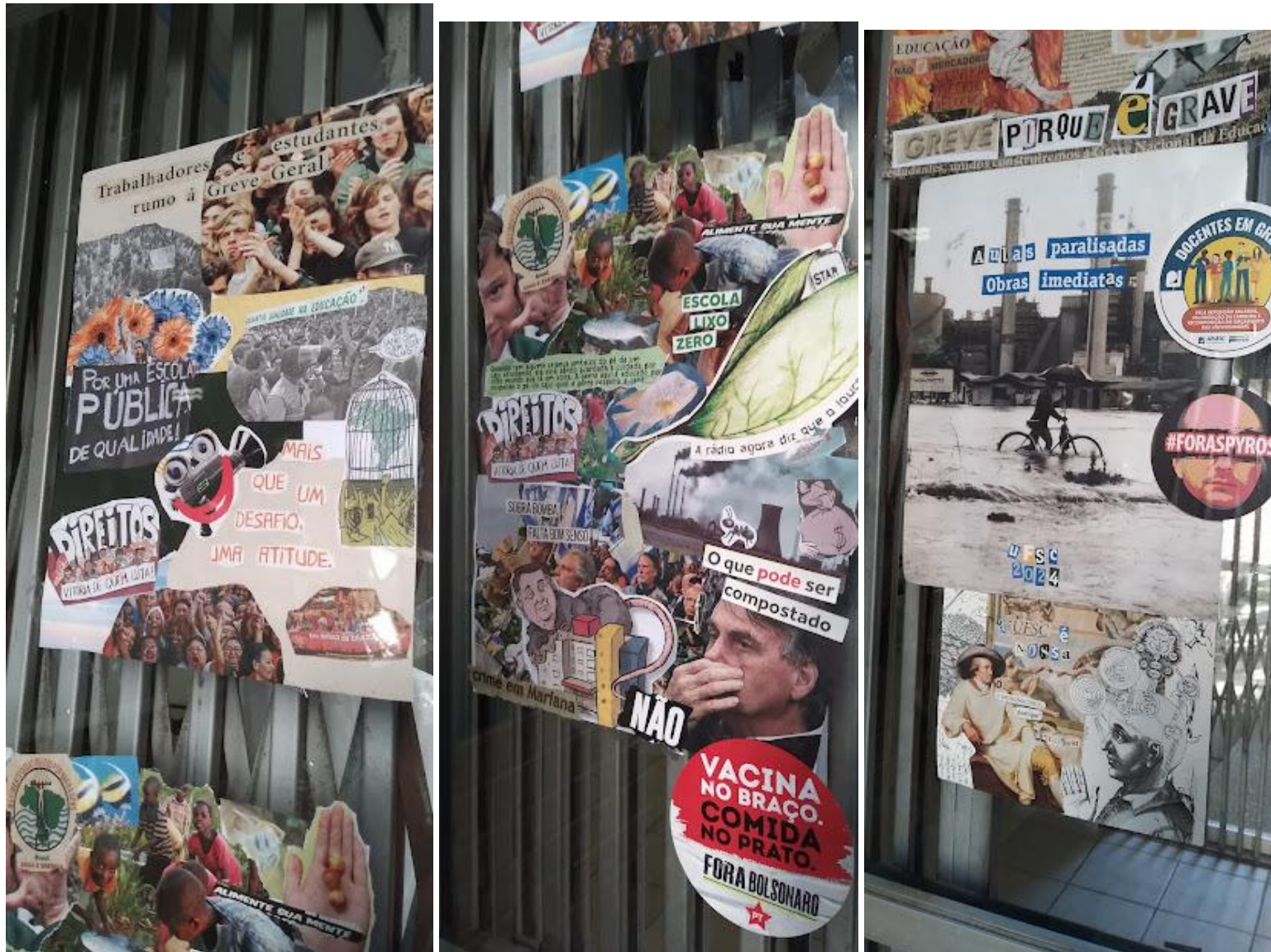
Colagens que realizadas na oficina e expostas nas portas de entrada do Bloco A do Centro de Ciências Biológicas (CCB)