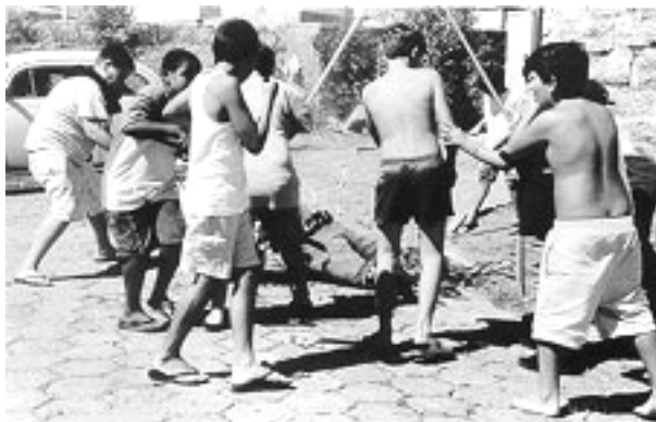
Fig. 10 - Malhação do Judas - Ribeirão da Ilha - Abril 2001