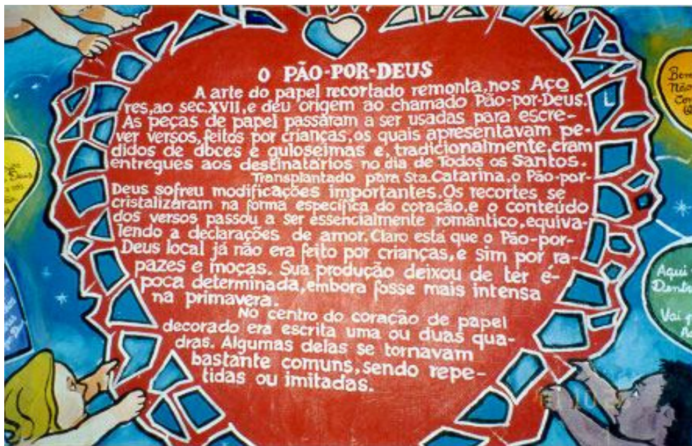
Fig.15 - Painel do Pão por Deus no interior de um bar de mesmo nome - São José - 2001

No mês de outubro - sendo o mês da Padroeira do Brasil - têm sido tradicionais há pelo menos duas décadas, as excursões de ônibus ao Santuário de N. Sra. Aparecida – São Paulo. 19