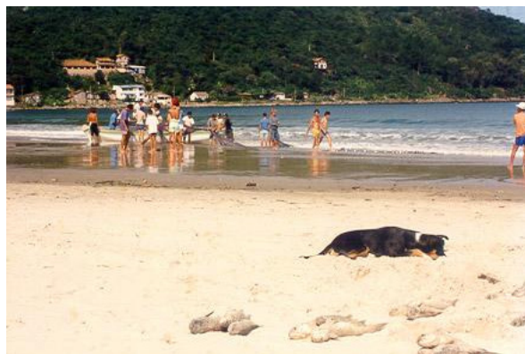
Fig. 7: Quinhões de peixes já separados. Pântano do Sul, s/d, por Viviane d'A. Heidenreich.

O parâmetro adotado para dividir os “quinhões” de peixes a que cada um tem direito é o número total de canoas (sete) multiplicado pela quantidade de vezes que cada camaradagem captura uma manta de tainha. A contagem dos quinhões é imediata, feita depois da captura e requer a presença