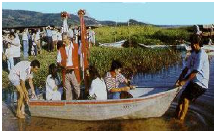
Fig. 11 – Bandeira peditéria da comunidade de Mirim, Município de Imarui, 100km ao sul de Florianópolis 2000

A Bandeira é carregada por irmãos que pertencem às inúmeras Irmandades do Divino Espírito Santo. Tais Irmandades já existem há pelo menos dois séculos mas sua atuação perdeu força com a contínua absorção da festa pela Igreja e suas comissões paroquiais. As tensões entre as comunidades locais e os padres em torno da festa do Divino e dos significados que ambos nela investem não são recentes e permanecem hoje em dia, propiciando situações contínuas de negociação (SERPA, op. cit.; ANAIS do I Congresso Intern. das Festas do Espírito Santo, 2000). Os irmãos saem vestidos com “opas” vermelhas levando a bandeira, a salva e a coroa. São acompanhados por uma cantoria tocando rabeca, tambor e viola. (f.12/13).