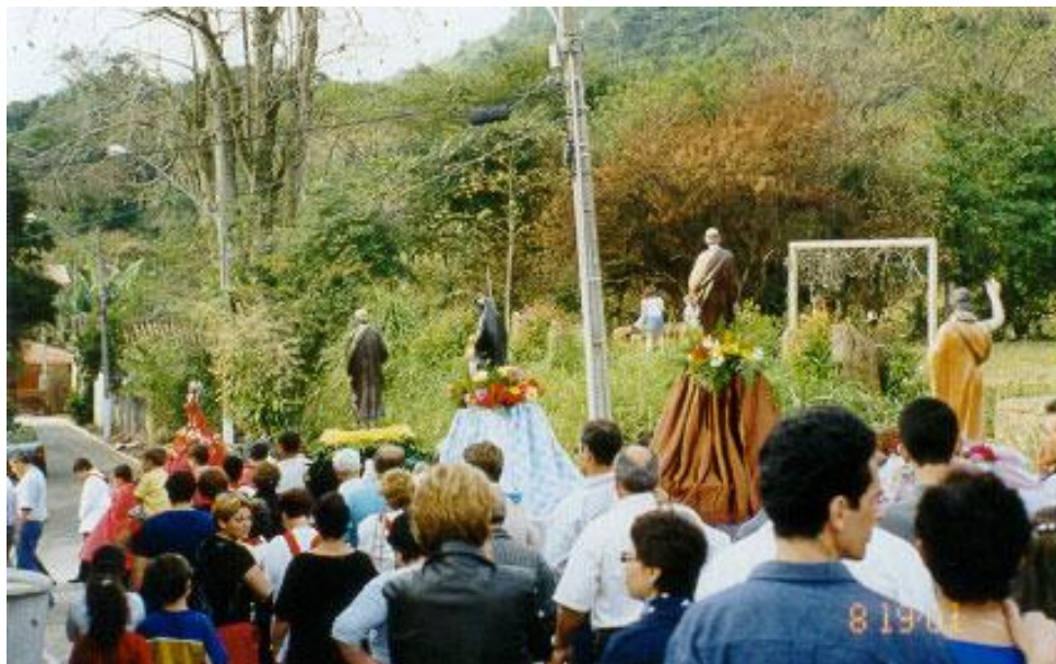
Fig 3 - Procissão de Santos Padroeiros - Ribeirão da Ilha 2001

N. Sra. de Navegantes, São Pedro, o Senhor dos Passos, Santo Antonio dos Anjos da Laguna e N. Sra. da Lapa do Ribeirão constituem os chamados santos padroeiros do mar e têm suas respectivas festas ao longo do ano (fig. 3). Já o Carnaval é a maior festa popular da região, assim como em todo o Brasil. Vem ocorrendo desde a primeira metade do século XIX. Pesquisas históricas dão conta de ser este o período em que mais se acumularam proibições e decretos contra o divertimento, mas também de ser a época em que menos se as respeitava (CABRAL, 1972). Há o carnaval de salão para as elites e o carnaval de rua, chamado “entrudo”, feito pelos populares. Em Florianópolis, o entrudo de carnaval tem, no Ribeirão da Ilha, sua manifestação mais antiga com a Banda do Zé Pereira (fig. 4) e o banho de mar dos mascarados e travestis (VALE PEREIRA, 1990).