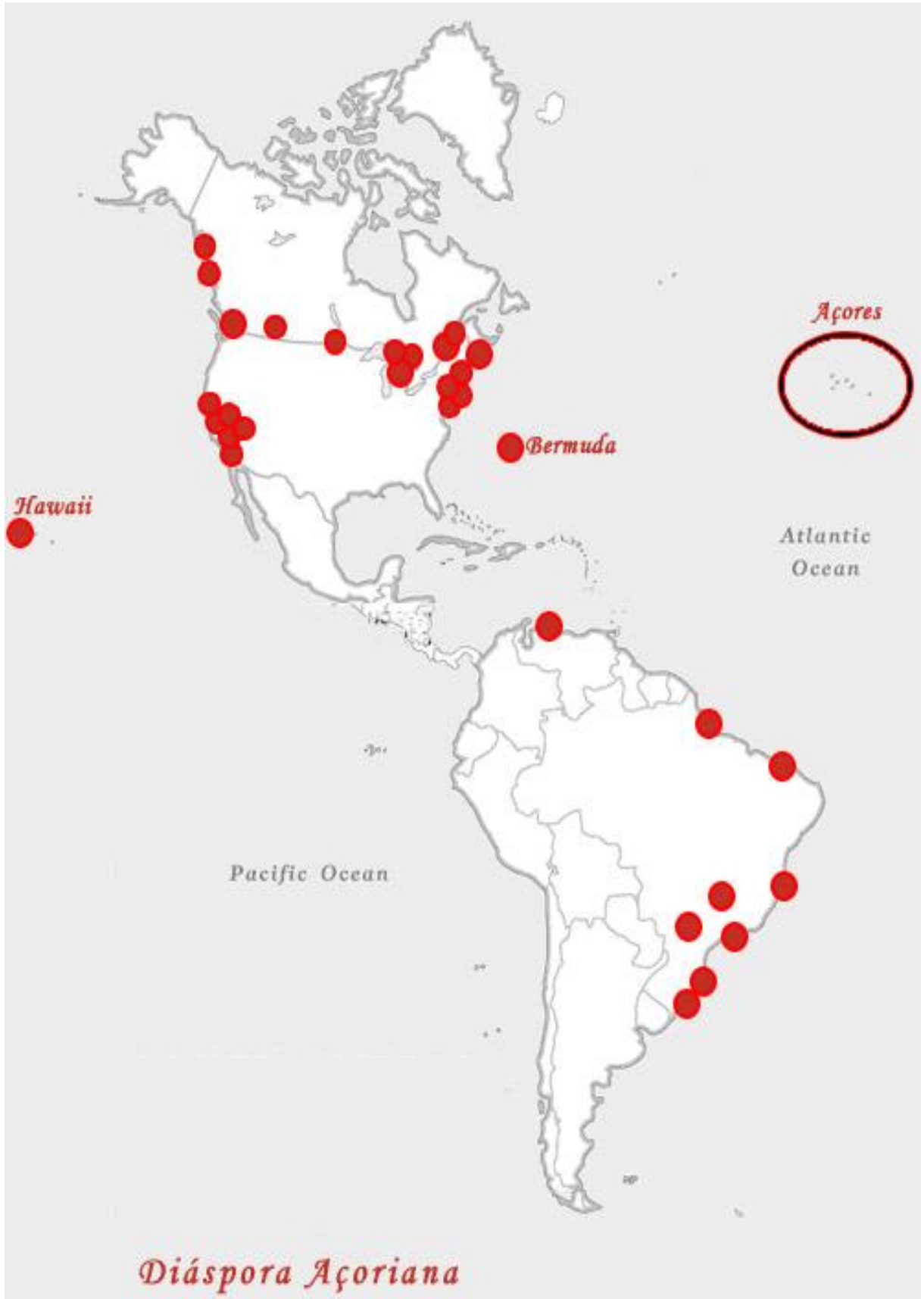
Fig. 3