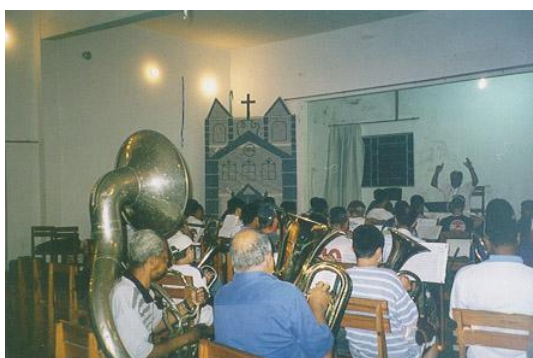
Fig. 3: Ensaios da Banda N. S. da Lapa, 2001.

Houve uma vez um ensaio conjunto das três bandas da cidade, preparatório da apresentação comemorativa ao dia do músico (25 de novembro). Na hora marcada, chegou um ônibus fretado com os membros das duas outras bandas, trazendo também mulheres, avós e filhos. O ônibus foi cedido, isto é, alguém fez o pedido na secretaria dos transportes. Estes