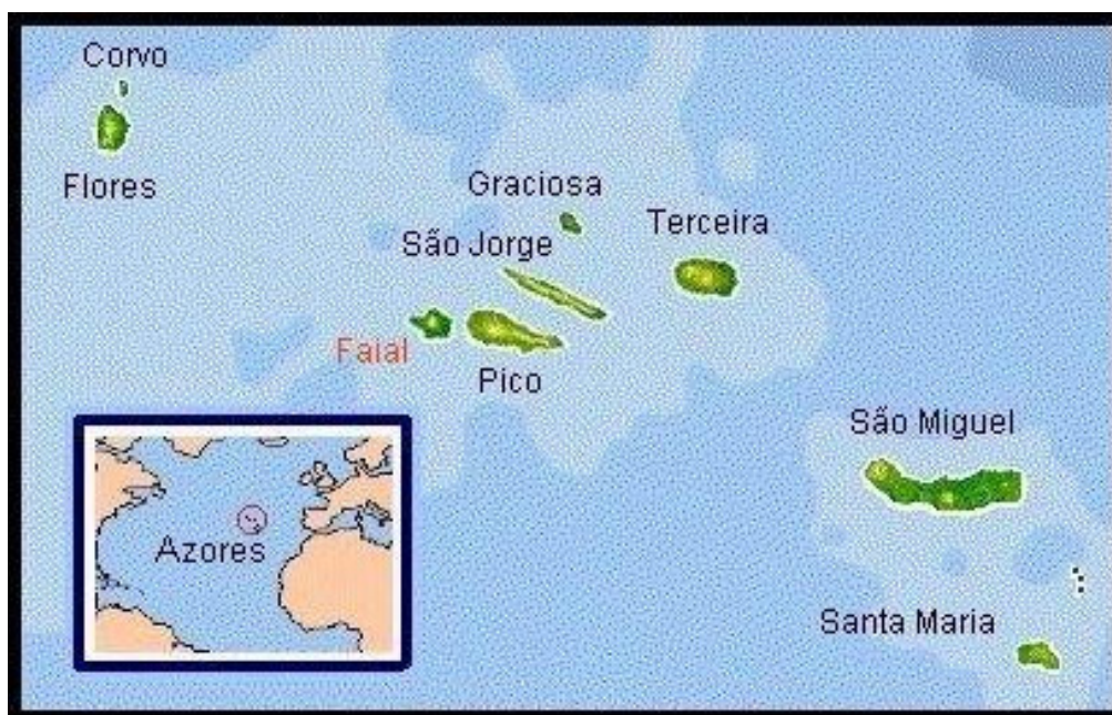
Fig. 1 – Mapa dos Açores

As ilhas têm várias formas, desde a quase circular até à muito alongada, resultantes dos diversos maciços vulcânicos que, interligados, as constituem. Situado no ponto de intersecção das placas tectónicas europeia (Terceira, Graciosa, S.Jorge, Faial e Pico), africana (S. Miguel e S.ta Maria) e americana (Flores e Corvo), o arquipélago dispõe-se em arco alongado, sobre a cordilheira submarina dorsal atlântica. O clima é temperado atlântico, fortemente influenciado pelas correntes quentes do Golfo do México, com temperaturas médias anuais da ordem dos 17° C. e umidade relativa cuja média também anual é de 79%. Nestas condições, a vegetação do Arquipélago mantém-se exuberante e, sobretudo a partir de finais do século XVIII, foi possível ali introduzir espécies tropicais ou subtropicais com êxito. O solo, de origem vulcânica, ocupado antes do descobrimento (1432) por uma floresta de tipo atlântico que ainda pode reconhecer-se por algumas manchas existentes em várias ilhas, ora é fértil ora é recoberto por um manto de lava recente - o chamado “biscoito” - só aproveitável para vinhedos ou matas. A origem vulcânica leva a que em várias ilhas existam centenas de fontes de água termal (“fumarolas”), túneis e cavernas.