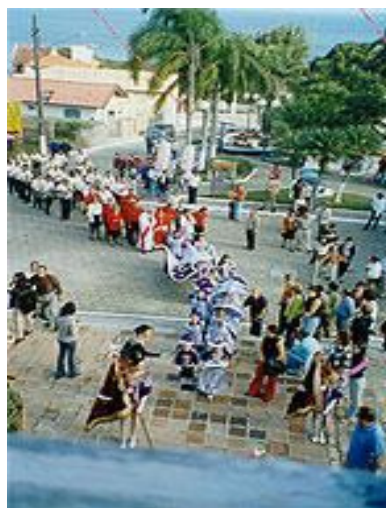
Fig. 12 - Cortejo imperial, foliões e banda - Ribeirão da Ilha Março 2001

A cantoria sai em jornada indo nas casas sempre durante o dia, levando uma bandeira com uma pomba branca em destaque, com fitas penduradas em seu mastro. As fitas significam promessas pagas e são da altura da pessoa que alcançou a graça pedida ao Divino. A pomba em cima é de madeira e vai com as asas fechadas, representando a humildade da visita e do pedido de auxílios ou prendas para a grande festa. A Bandeira entra casa a dentro, passa por todos os cômodos, nas camas dos enfermos, chegando mesmo às plantações e ranchos de