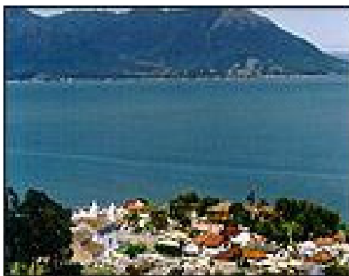
Fig 2: Freguesia do Ribeirão da Ilha, 2001. Gentilmente cedida por Rafael Colli

A Freguesia, que até os anos 60 vivia em torno da pesca e de alguma atividade agrícola, foi perdendo densidade demográfica e vive hoje do turismo e do comércio, com restaurantes, bares e a criação de ostras, uma atividade que cresceu vertiginosamente durante os anos 90 por toda a costa litorânea do distrito. De todo modo, a sensação em dias não agitados é a de que o