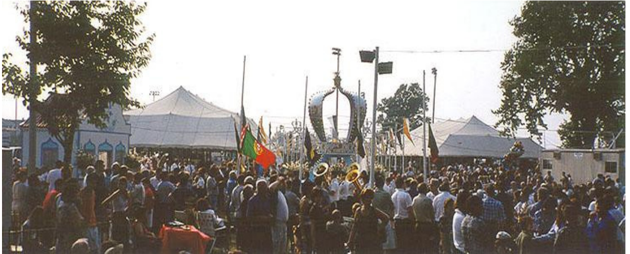
Fig 4 - Panorâmica do Kennedy Park - Fall River - Massachusetts – agosto de 2000

A programação básica da festa constava de atividades diurnas e noturnas, destacando-se no primeiro dia, as aberturas solenes; o segundo dia, para a juventude, com apresentações, sempre bilíngües, de músicos locais; o terceiro, dia para a benção e distribuição das “pensões” (massa e carne) para as famílias necessitadas e casas de caridade; também no terceiro dia, para o “cortejo e desfile etnográfico” (Fig. 5), distribuição de leite, massa doce e arrematações; o quarto dia, domingo, para missa bilíngüe e procissão da coroação das rainhas das irmandades e novas arrematações e apresentações de banda; no ultimo dia, organiza-se um banquete oferecido às autoridades políticas e religiosas presentes no evento.