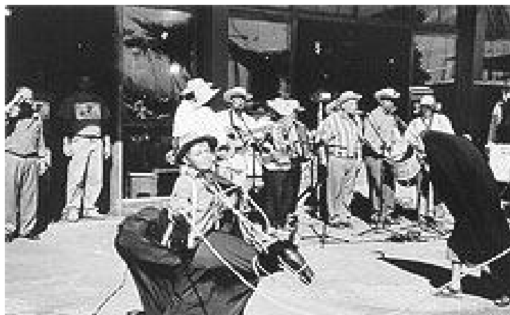
Fig. 1 - Boi de Mamão do Sambaqui - Florianópolis 2001

Este período abre o ciclo de festas, cultos e folguedos nas comunidades e se estende até a Quaresma. Coincide com a abertura oficial da temporada turística do verão. Note que a abertura do ciclo já teve seu sinal nas florações da primavera, com a formação de ventos propícios a soltar pandorgas; com a maior insolação, fazendo com que os homens exibam seus pássaros cantadores a tomar banho de sol (MOTA, 2001); com o 'choro' aos mortos e a circulação do "Pão-por-Deus" (voltaremos a este ponto).