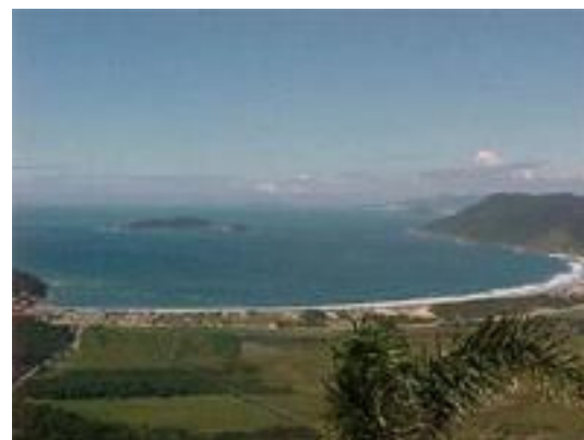
Fig. 6: Ferradura da Praia do Pântano do Sul, Disponível: suldailha.com.br .

A certa hora, chegou um rapaz dizendo que, nos Naufragados, a praia atrás do morro, tinham capturado milhares de tainhas, mas isso não era confirmado e ninguém deu muita importância. Pareceu-me “conversa de pescador”, daquela que serve para manter em alta o clima de expectativa. Falei ao meu informante que, na