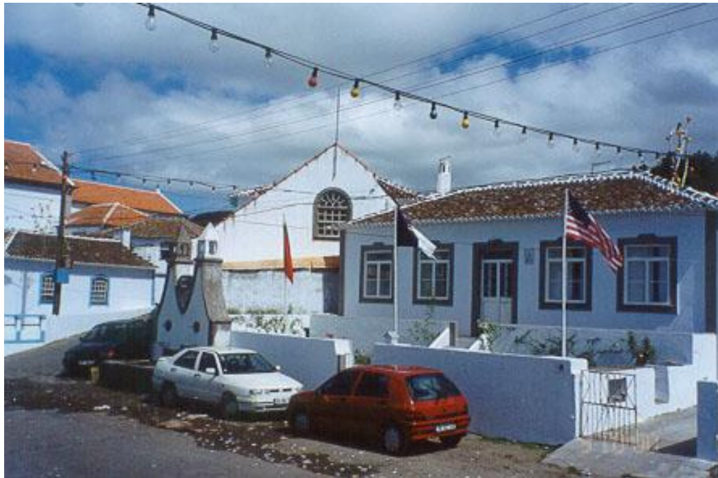
Fig 2 – Casa de imigrante nos Açores com as bandeiras dos Estados Unidos, Açores e Portugal - setembro de 2000.

movimentos associativos que em cada espaço e em cada tempo assumem diferentes níveis de formalização e variadas atividades. É no âmbito dos movimentos associativos, como clubes, irmandades, sociedades culturais, associações religiosas que os grupos de origem açoriana têm vindo a procurar a identificação de interesses que os remetem a referências originais comuns e lhes permitem construir os símbolos capazes de lhes dar forma e expressão. Destes, o cruzamento de duas bandeiras (fig 2), a do país de origem e do país presente, é talvez o mais freqüente e, sem dúvida, o que melhor traduz um modo de pertencimento intencionalmente partilhado (ROCHA-TRINDADE, 1989).