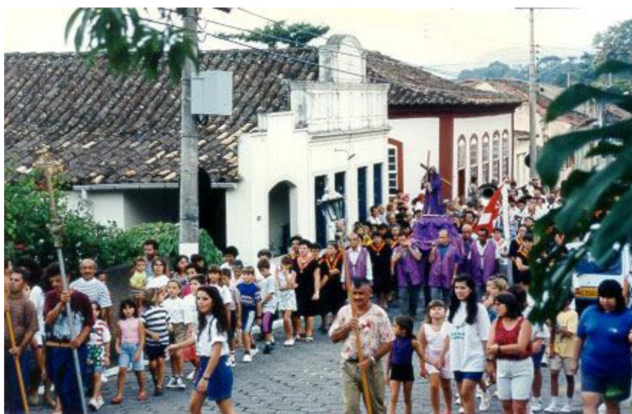
Fig. 7 - Procissão do Passos - Ribeirão da Ilha - 1988