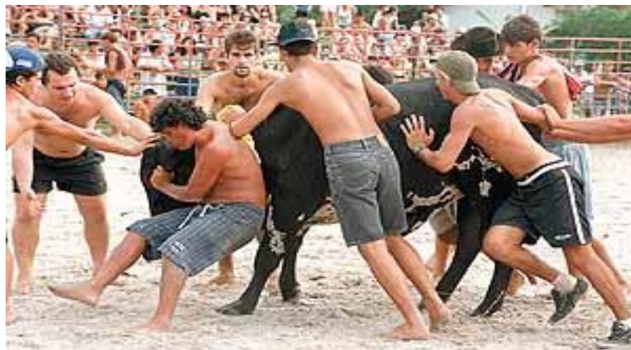
Fig. 9 - Boi mangueirado