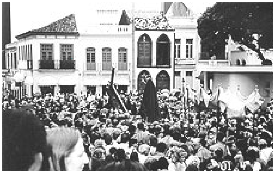
Fig. 6 - Procissão do Passos - Centro de Florianópolis 2001