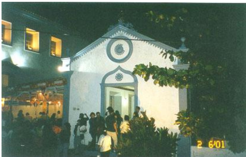
Fig. 14 – Império do Divino – Ribeirão da Ilha – junho de 2001

pesca. Pedacinhos de fita a cor vermelha da bandeira são usadas como amuletos e também para fazer chá. Quando anoitece, a bandeira e os foliões pousam na casa de algum irmão pelo caminho e lá fazem uma novena. Depois é feito o arremate das oferendas. Tais recursos servirão para a realização da festa principal, com a presença da família e cortejo imperiais. É comum as Bandeiras amanhecerem em andanças e, tal qual os Ternos de Reis, os foliões recebem comidas e bebidas dos agraciados com a visita. A festa em si ocorre durante três dias em que há cortejos, missa festiva, decoração do Império (fig.14), bailes, shows, barraquinhas, apresentações folclóricas, bingos e queima de fogos. No último dia são coroados o Imperador e a Imperatriz e por fim, sorteados ou eleitos o novo casal festeiro que coordenará as festividades do ano seguinte.