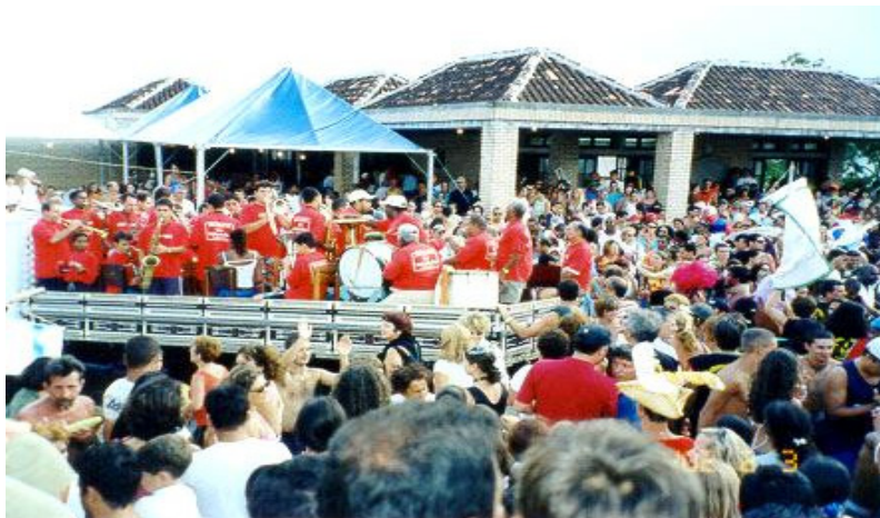
Fig 4 – Banda do Zé Pereira - Entrudo de Carnaval - Ribeirão da Ilha 2001

Mas o carnaval de rua só mantém sua expressão graças às “sociedades carnavalescas”, formadas no início do século e que hoje persistem ao lado das escolas de samba como verdadeiros núcleos de resistência da cultura afro-brasileira em Santa Catarina. (TRAMONTI, 2001; MORTARI, 2001 ). Nos desfiles, notamos a exposição permanente de temas da cultura popular local, seja de base açoriana, africana ou indígena.