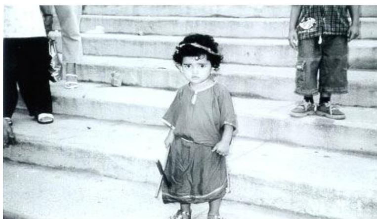
Fig. 5 - Menino na procissão pagando promessa ou fazendo pedido – Centro – 2001

sendo a de Florianópolis a mais popular e antiga. Organizada pela Irmandade do Senhor dos Passos, fundada em 1º de janeiro de 1765, a procissão contorna as ruas históricas do centro da cidade, carregando a imagem angustiada dos Senhor dos Passos, que encontra com sua Mãe pelo caminho. A imagem está em Florianópolis desde 1764. É a maior cerimônia religiosa da região, ocorrendo tanto o povo em massa quanto as autoridades políticas. É comum ver um grande fluxo de pessoas do interior da ilha para o centro de Florianópolis. Ali o povo paga promessas, alguns vestem seus filhos como Cristo (fig.5).