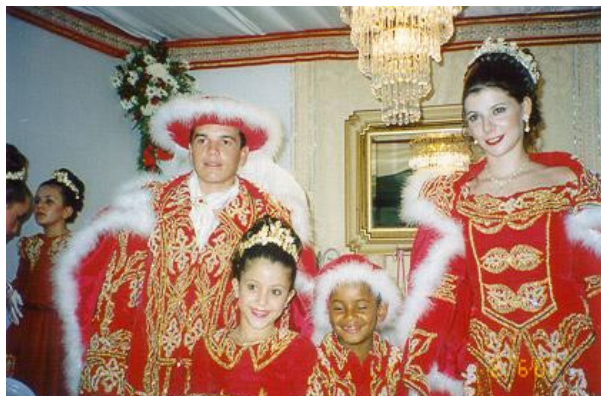
Fig. 5: Rei e Rainha no Império, Ribeirão da Ilha, 2001.

Tudo se movia com lentidão, quebrada apenas pelos fogos de artifício. As pessoas saíam às ruas para ver o cortejo passar. Na entrada, mais uma saraivada de fogos. Todos entraram, lotando a igreja, menos a banda, que aguardaria sua apresentação depois da missa. A missa longa foi festiva e terminou com a ida do cortejo até ao Império, uma pequena construção situada ao lado da igreja.