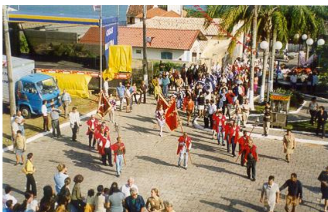
Fig. 4 - Cortejo do Divino no Ribeirão da Ilha , 2001

Sábado à noite. Chegou a hora da festa. Na saída do cortejo da casa do imperador, uma saraivada de fogos. Já a essa altura havia muita movimentação na praça da igreja matriz, com os últimos barraqueiros se instalando. Veio então o cortejo da casa do imperador até a matriz, em um trajeto de cerca de 300 metros. A composição do cortejo (fig. 4) pode ser assim