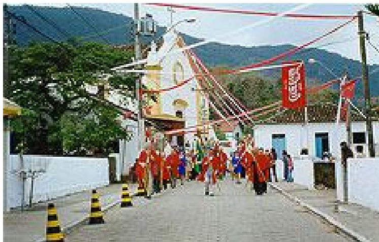
Fig. 13 - Procissão para buscar o casal imperial Sto. Antônio de Lisboa - Setembro 2001