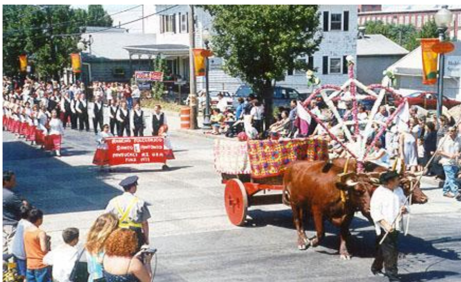
Fig. 5 - Desfile etnográfico - Fall River - Massachusetts agosto 2000

A programação básica da festa constava de atividades diurnas e noturnas, destacando-se no primeiro dia, as aberturas solenes; o segundo dia, para a juventude, com apresentações, sempre bilíngües, de músicos locais; o terceiro, dia para a benção e distribuição das “pensões” (massa e carne) para as famílias necessitadas e casas de caridade; também no terceiro dia, para o “cortejo e desfile etnográfico” (Fig. 5), distribuição de leite, massa doce e arrematações; o quarto dia, domingo, para missa bilíngüe e procissão da coroação das rainhas das irmandades e novas arrematações e apresentações de banda; no ultimo dia, organiza-se um banquete oferecido às autoridades políticas e religiosas presentes no evento.