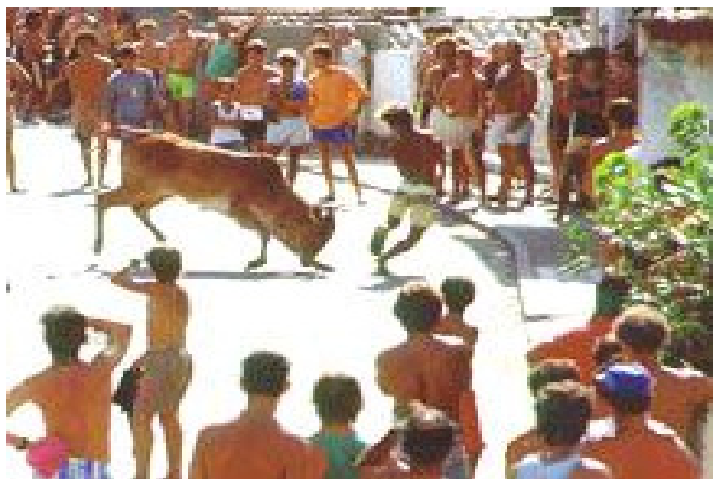
Fig 8 - Farra do boi solto

De qualquer maneira e onde quer que haja espaço verde como pastos, morros ou mesmo em bairros e praias pode haver a farra do boi (fig. 8). Atualmente, o boi bravo tem sido brincado em “mangueirões” (fig. 9) que são áreas cercadas para este fim. Ela consiste em brincar, pegar ou fugir de um boi bravo, arisco e corredor. O boi é comprado ou alugado nas fazendas da região por grupos de sócios que podem ser de homens, mulheres, crianças, solteiros ou casados, tudo conforme a localidade.