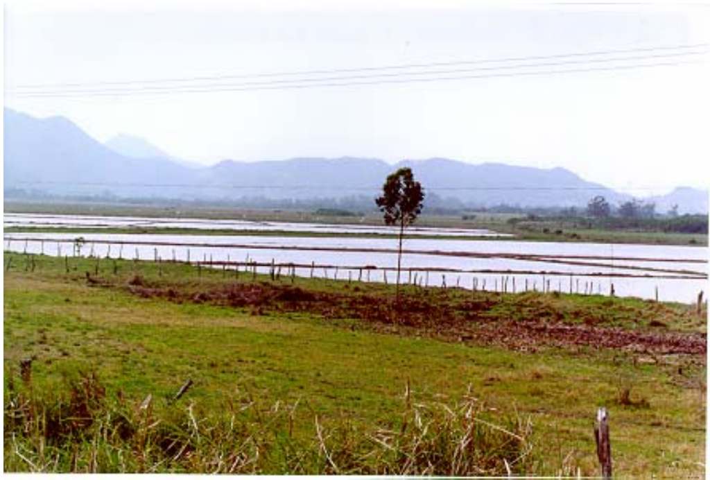
Figura 5: Plantação de Arroz em Garopaba