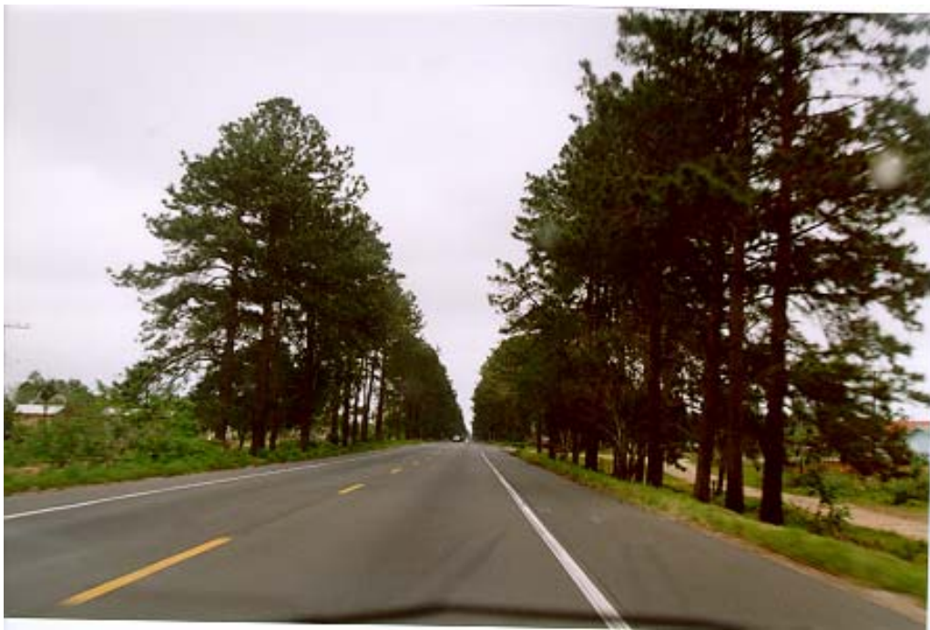
Figura 10: BR101