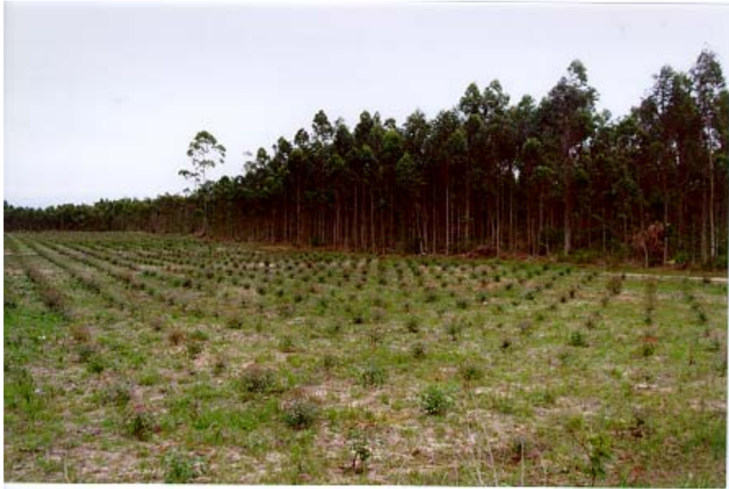
Figura 8: Reflorestamento de Eucalyptus em Araranguá