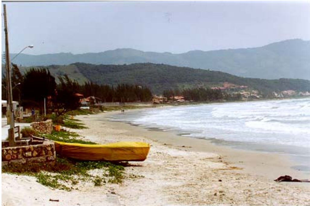
Figura 21: Restinga da praia de Garopaba