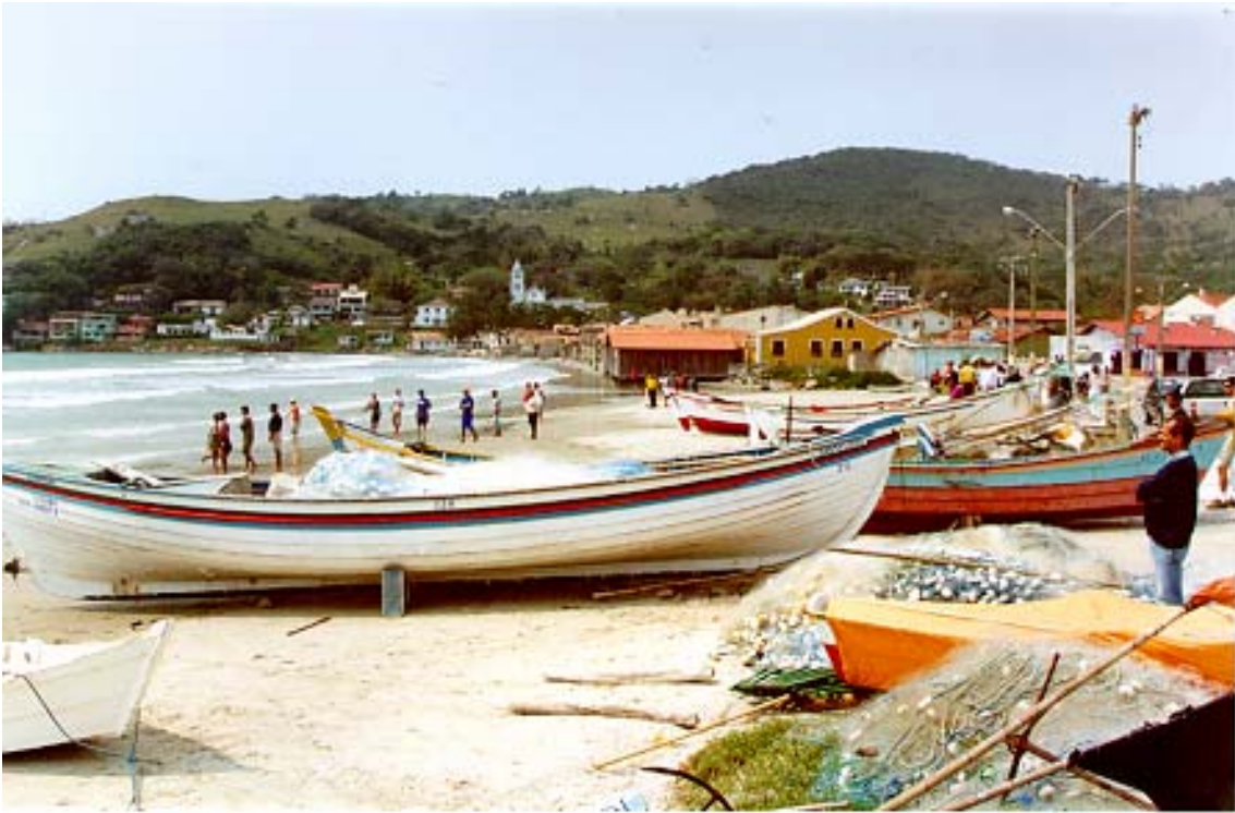
Figura 17: Pesca artesanal em Garopaba

A Figura 17 mostra atividades de pesca artesanal no município de Garopaba.