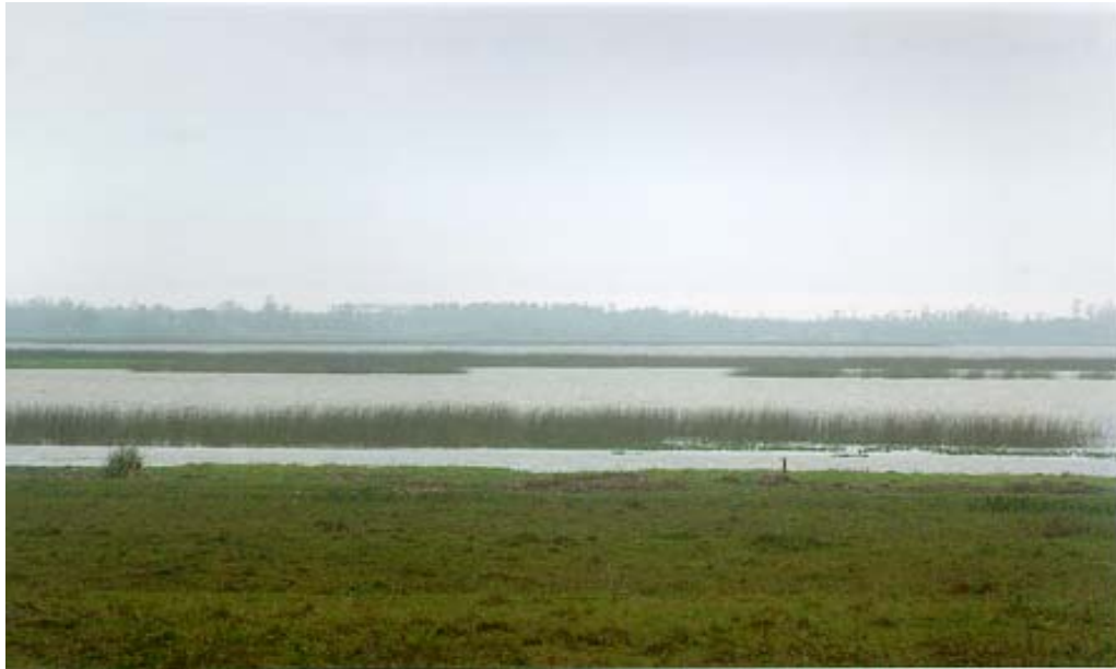
Figura 23: Marismas na lagoa de Sombrio (Halossera)