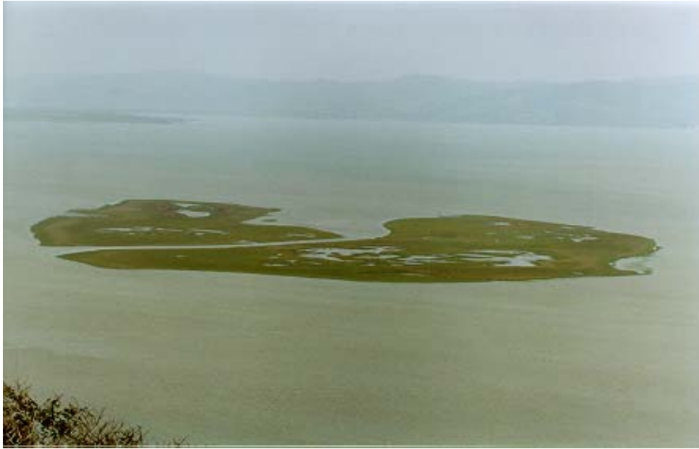
Figura 22: Marismas da Lagoa de Santo Antônio (Halossera)

As marismas na lagoa de Santo Antônio em Laguna (Figura 22) e da lagoa de Sombrio (Figura 23) são exemplos de halossera e o banhado doce de Itapirubá (Figura 24) e Arroio e Silva em Araranguá (Figura 25) de helossera.