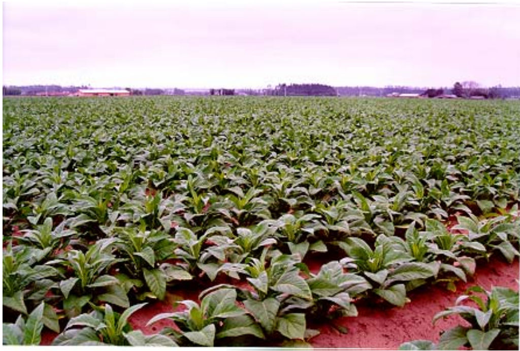
Figura 4: Plantação de Fumo em Maracajá