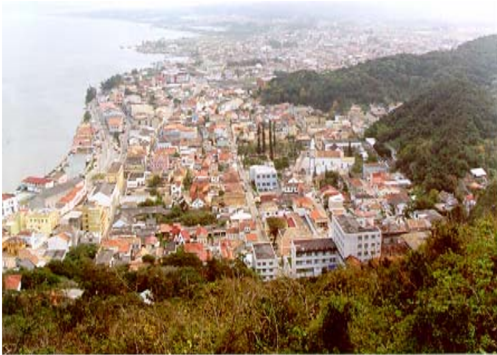
Figura 11: Cidade de Laguna sobre Ecossistemas Costeiros