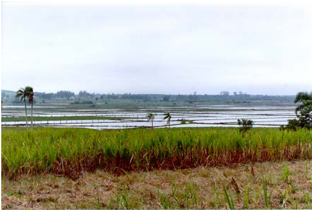
Figura 7: Roça de cana-de-açúcar e ao fundo plantação de arroz em Jaguaruna