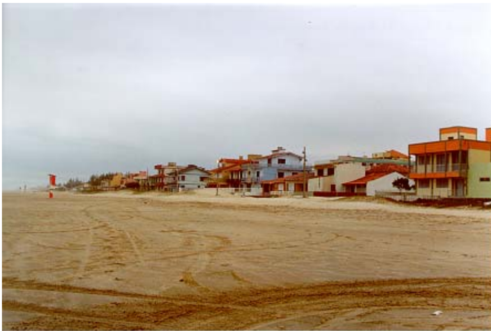
Figura 12: Construções urbanas sobre a praia de Arroio e Silva