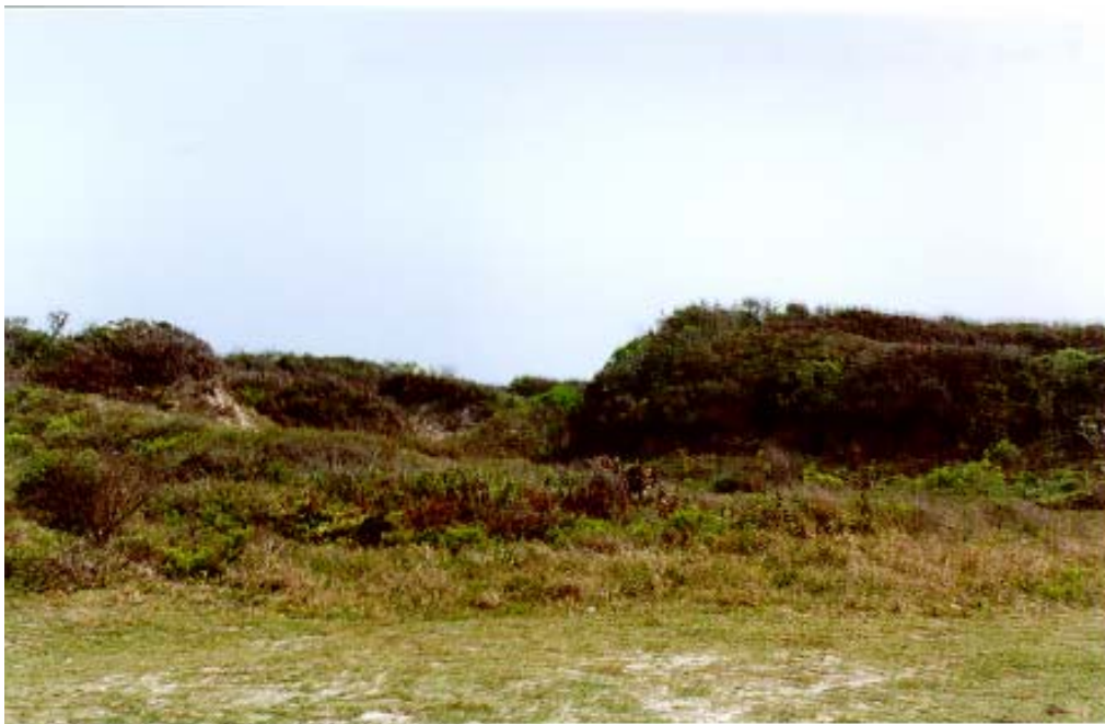
Figura 18: Restinga de Paulo Lopes

Já a restinga de Garopaba (Figura 21), onde a ação antrópica é maior, com atividades como a pesca artesanal durante todo o ano, a vegetação se encontra fragmentada e alguns locais é praticamente inexistente.