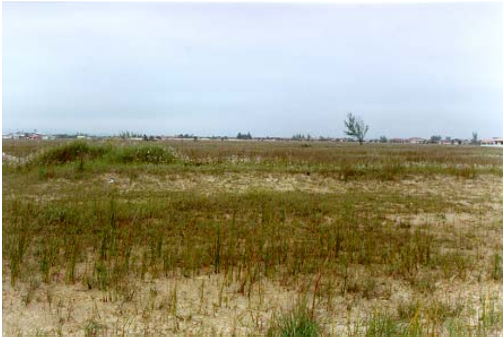
Figura 9: Planície na restinga de Imbituba