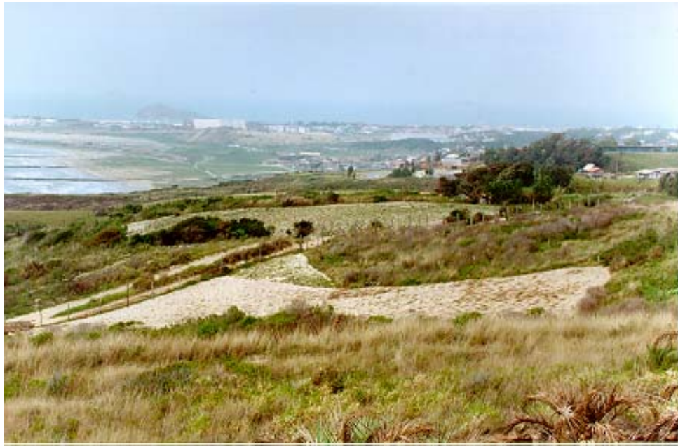
Figura 15: Plantação de mandioca na vegetação de restinga de Imbituba

O uso inadequado do solo para cultivo de vegetação de valor comercial nos ecossistemas naturais descaracteriza os ambientes naturais, como a plantação de mandioca em plena restinga em Imbituba (Figura 15 e 16).