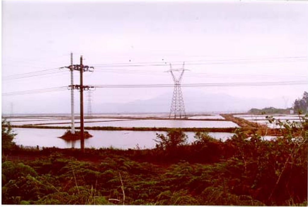
Figura 6: Plantação de arroz em Capivari de Baixo