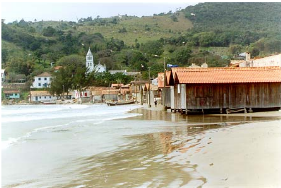
Figura 14: Construções suspensas na praia de Garopaba