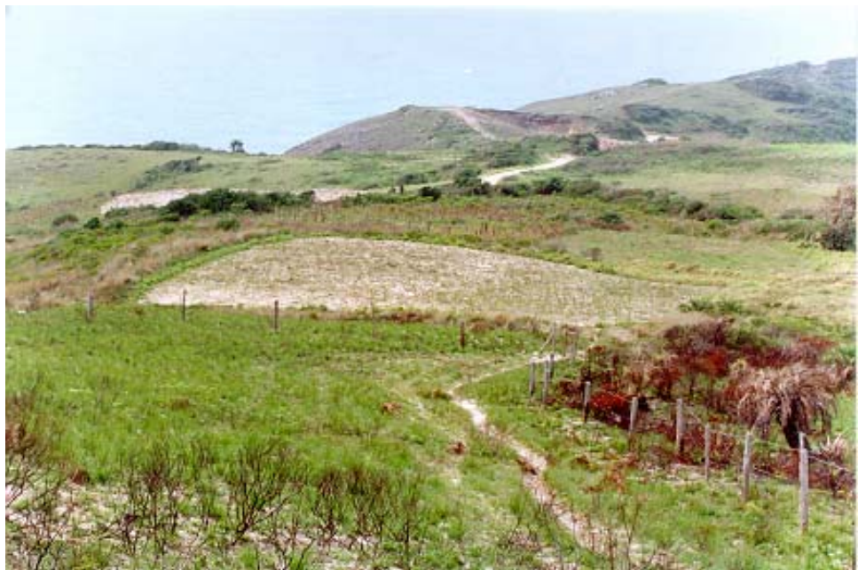
Figura 16: Plantação de mandioca na restinga