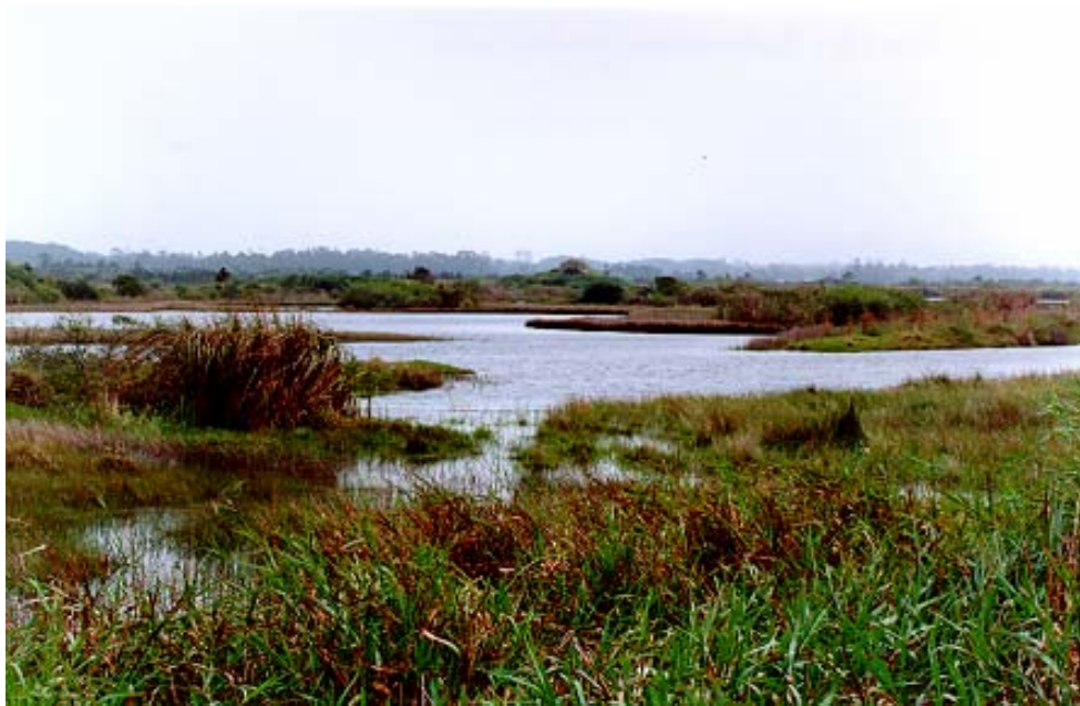
Figura 24: Banhado doce de Itapirubá (Helossera)

A figura 24 (Banhado doce de Itapirubá) e a figura 25 (Banhado doce de Arroio do Silva), são exemplos de helossera.