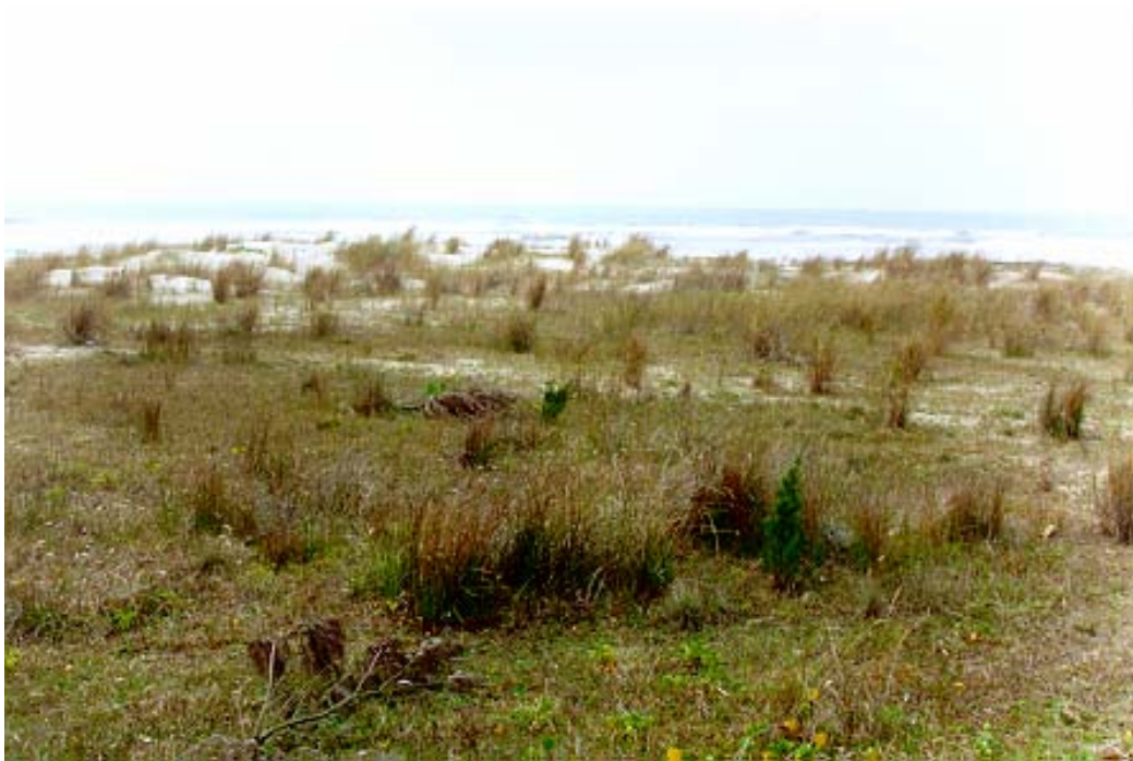
Figura 20: Restinga da praia de Itapirubá