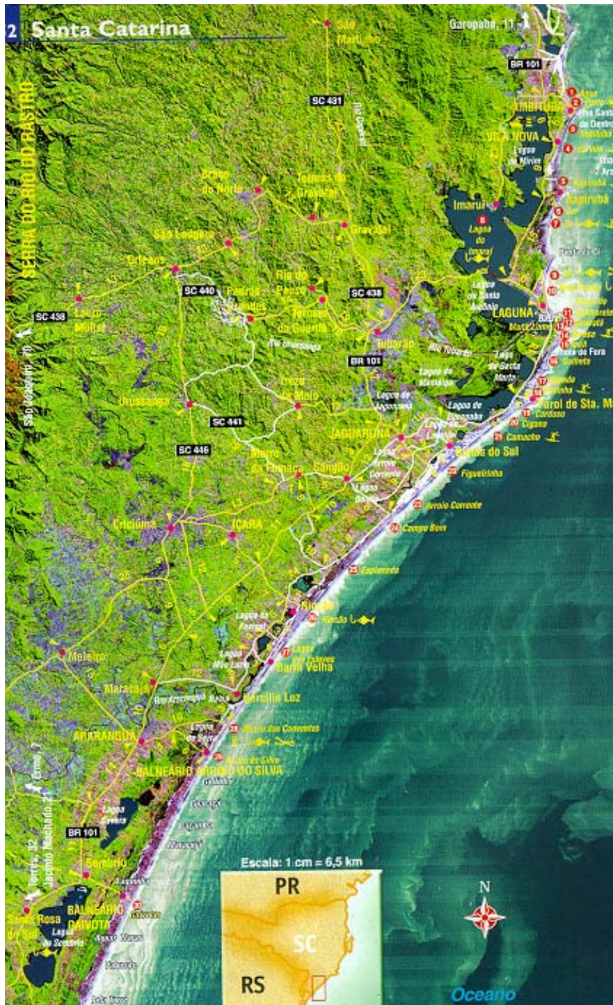
Figura 2: Área de estudos: Microrregião costeira sul catarinense. Região entre Paulo Lopes e Sombrio.