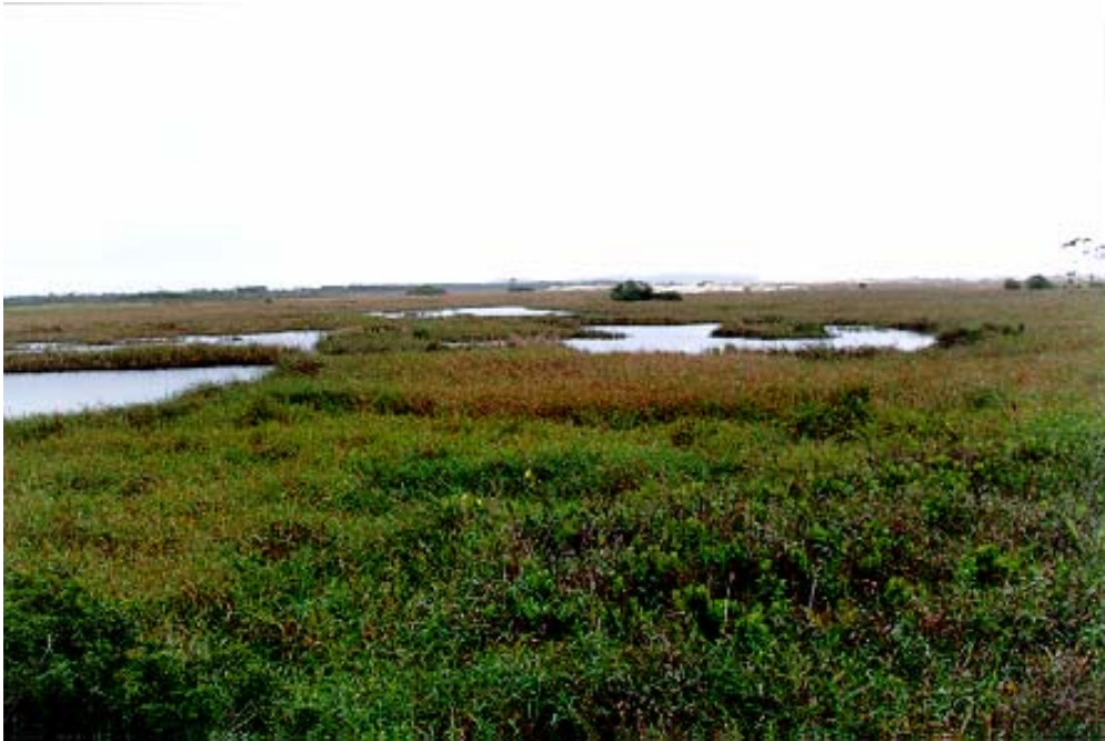
Figura 25: Banhado doce de Arroio do Silva (Helossera)

A distribuição das plantas na helossera comporta as seguintes etapas em toda a região: