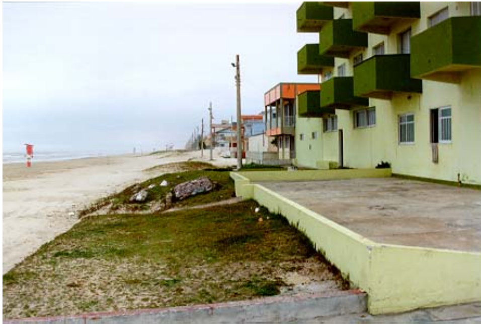
Figura 13: Construções urbanas sobre a vegetação de Restinga