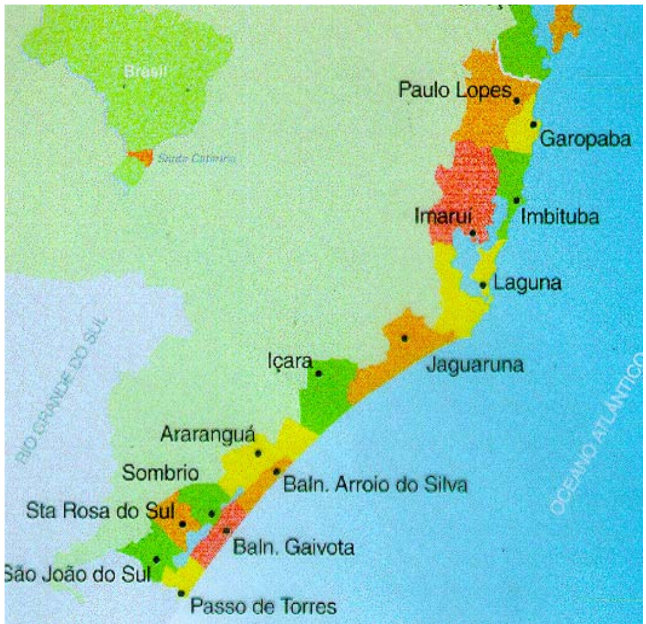
Figura 1: Área de Estudo: Microrregião costeira sul catarinense. Região entre os municípios de Paulo Lopes e Sombrio.

Na região ocorre ocupação humana desordenada, incluindo construções residenciais, comerciais, industriais, mineradoras e obras de infra-estrutura, como rodovias e estradas.