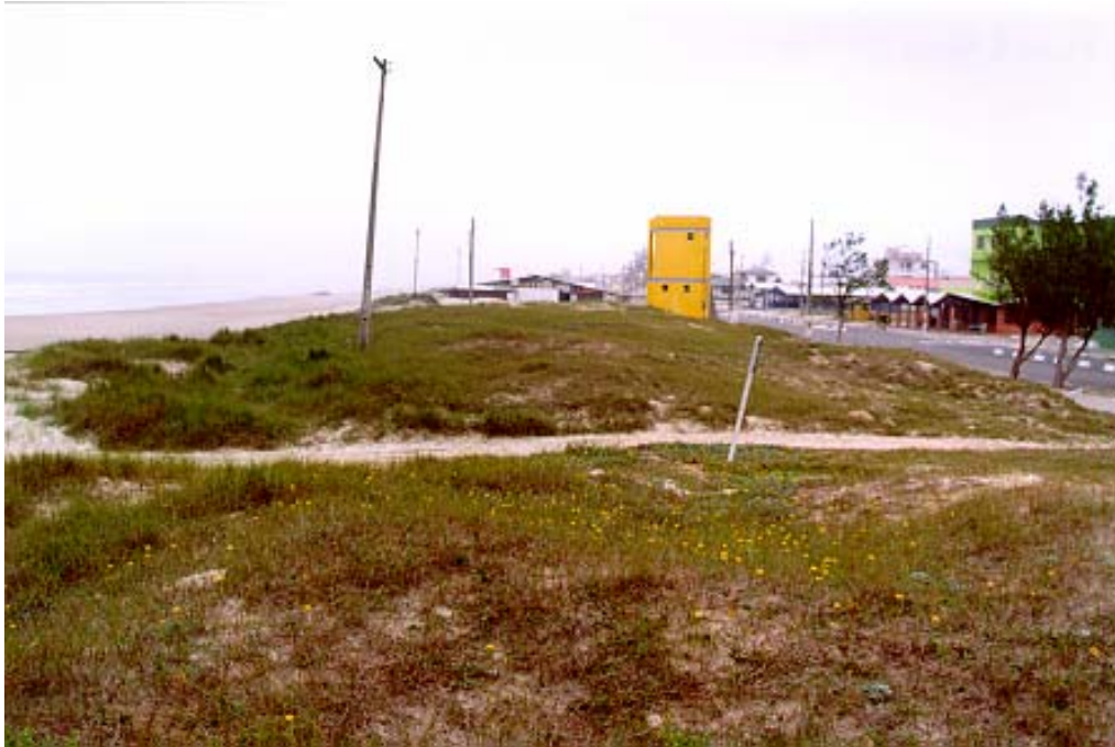
Figura 19: Restinga “Balneário Gaivota”