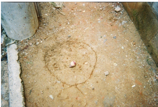
Figura 6. Foto de Atabaque (escola Pastinha) da brincadeira de pião próximo à sua casa.

Sua participação na escola, conforme relatos da avó, é tranqüila, com poucas ocorrências, apenas “uma vez no ano” 254 e relata não haver nunca reprovado. Atabaque , embora cite conhecer algumas crianças na vizinhança, com quem brinca, diz ter apenas um verdadeiro amigo, que, inclusive, apoiou-o no momento em que desejou tirar as fotografias de seu cotidiano para a pesquisa – enquanto que as outras crianças satirizaram-no por esta iniciativa 255 . Embora, aparentemente, sua tia haja