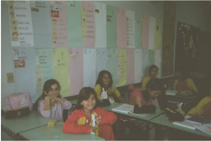
Figura 2. Fotografia de Palmas em sala de aula (escola Bimba).

Tal disposição demonstrada por estes dois alunos em fotografar a escola, ou mesmo sua participação nas aulas parece evidenciar um sentimento positivo relacionado à sua presença na escola Bimba. Penso que possa evidenciar, a partir destas fotos (e do que foi mencionado, e que também ainda o será), a construção de sentidos no mundo dos alunos pelo seu pertencimento e interação com a escola Bimba.