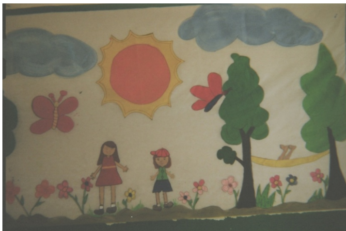
Figura 1. Fotografia de Berimbau (Escola Bimba) de um mural da escola que disse achar bonito.

alunos-sujeitos que participaram da pesquisa, ao realizarem a primeira etapa do procedimento midiático da pesquisa 194 , tiraram fotos da/na escola Bimba. O aluno Berimbau, tirou uma foto de um mural na escola Bimba “feito pela outra quarta série”, porque disse ter achado “bonita a imagem 195 ”, tratava-se de um mural confeccionado com recortes de cartolina colorida retratando um desenho de crianças brincando em um lugar verde, florido, com sol e borboletas: