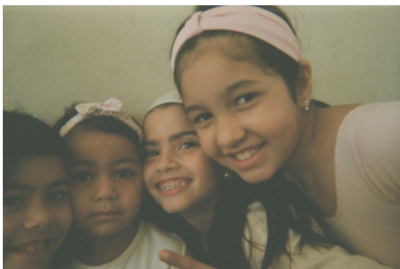
Figura 4. Foto tirada por Palmas na aula de ballet (escola Bimba ).

Trataremos agora da análise dos dados relativos o mundo vivido e participação nas aulas de capoeira do sujeito-aluno Berimbau (11 anos de idade, 4ª série, escola Bimba ). Realizamos a entrevista no dia 24 de maio de 2010 na casa 230 do Berimbau , ocasião em que conversamos com sua avó (responsável), tendo em vista este ter pouco contato com sua mãe (evitando mesmo falar sobre o contato que tinha com seu pai, nas ocasiões em que perguntei) 231 . Como dito anteriormente, no início da entrevista-diálogo, experimentei certa desconfiança por parte da avó de Berimbau 232 , porém, durante o decorrer da conversa, fui notando a