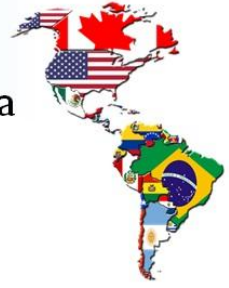
Cantidad de inscriptos para 2011