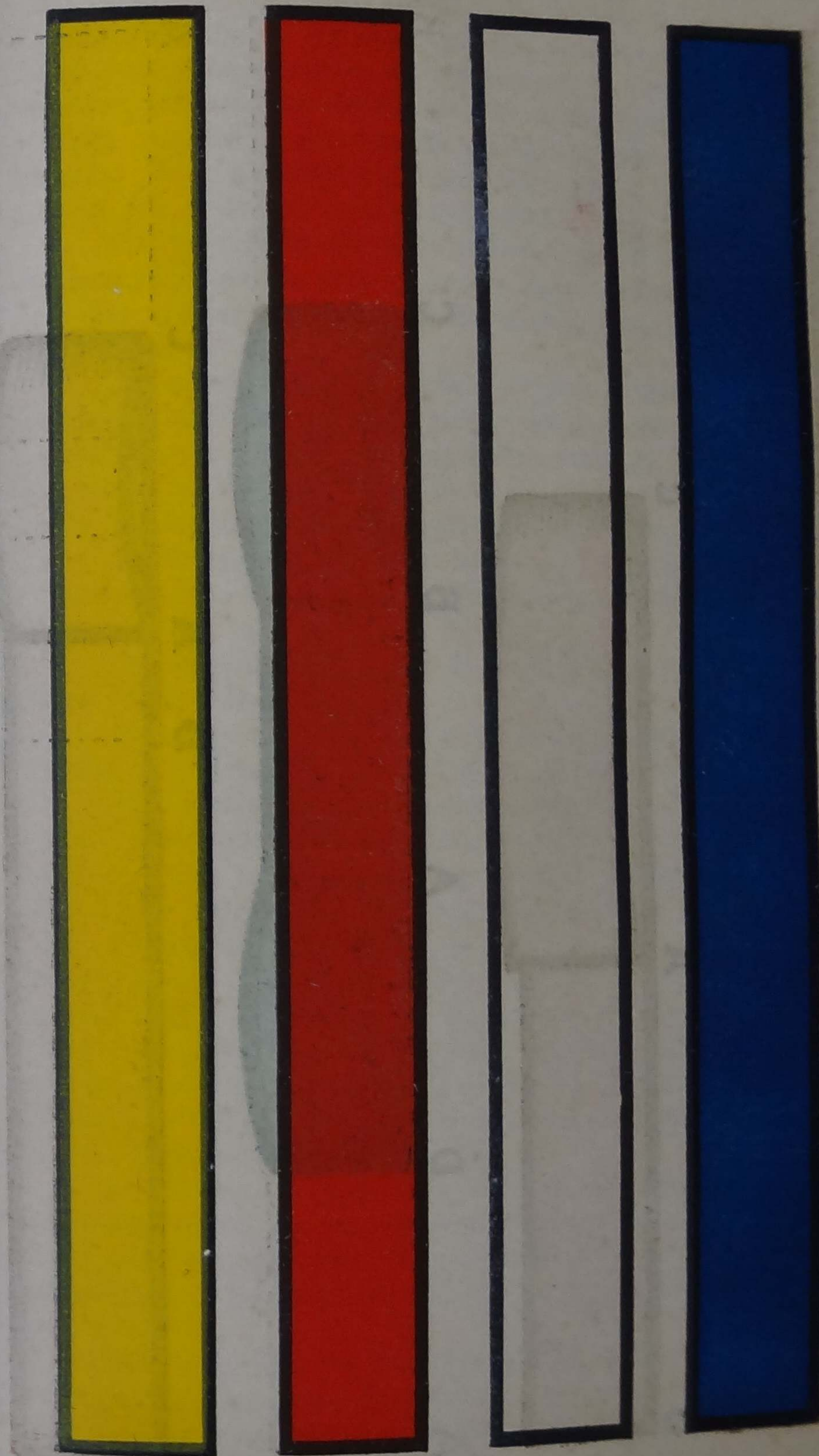
Fig. n.º 1

Geralmente, o papel que se emprega no estudo das frações é dividido de um modo apenas mecanico: enrolando-o, dobram-n'o professores e alunos em umas tantas partes, ajustando-as umas sobre as outras como uma peça de renda ou de fita, por tal forma, que a banda externa será sempre, fatalmente, maior que qualquer das demais internas.